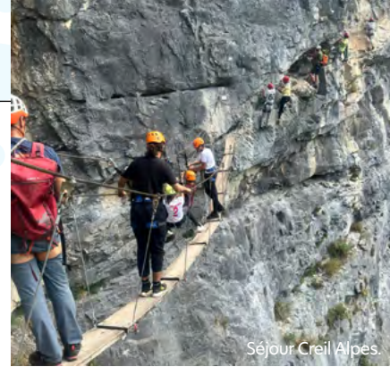
Séjour Creil Alpes.

Manga, jeux vidéo, cosplay, musique et animations vous attendent pour une immersion au cœur du Japon.