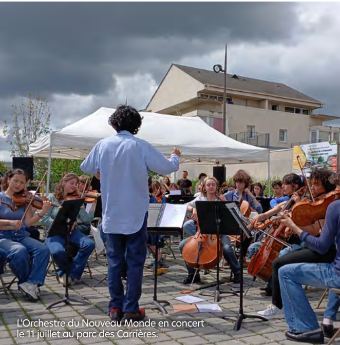
L'Orchestre du Nouveau Monde en concert le 11 juillet au parc des Carrières.

La musique s'invite au parc des Carrières, au quartier du Moulin, samedi 11 juillet à 18h30 à l'occasion d'un concert exceptionnel de l'Orchestre du Nouveau Monde. Depuis plusieurs semaines, une vingtaine de Creillois.es, adolescents.es et adultes, participent à des ateliers encadrés par les professeurs du Conservatoire Nina Simone. Réunis autour du projet En avant la musique , ils ont appris et perfectionnent leur pratique instrumentale avec un objectif : rejoindre l'Orchestre du Nouveau Monde le temps d'un concert. Gratuit et ouvert à tous, ce rendez-vous est proposé par la Maison de la Ville, en partenariat avec le Conservatoire Nina Simone, S.A. de l'Oise fête l'été, 1001 Vies Habitat, Oise Habitat, l'ACSO et le Centre Georges Brassens.