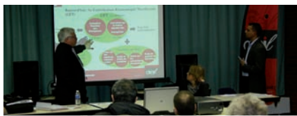
Réunion publique au centre des rencontres

Le vote du budget est un temps fort dans le fonctionnement d'une municipalité. C'est pourquoi la ville a souhaité rencontrer les