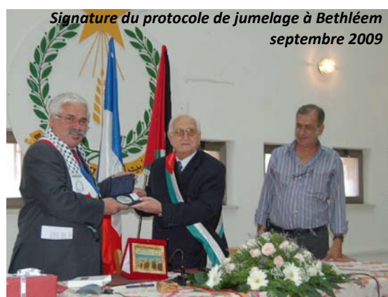
Signature du protocole de jumelage à Bethléem septembre 2009

En septembre 2009, une délégation creilloise s'est rendue à Bethléem pour sceller cette entente. Un protocole de jumelage a alors été signé par les maires des deux villes, qui ont réaffirmé leur volonté d'établir une coopération mutuelle visant à développer les relations entre les deux collectivités, leurs élus et leurs habitants.