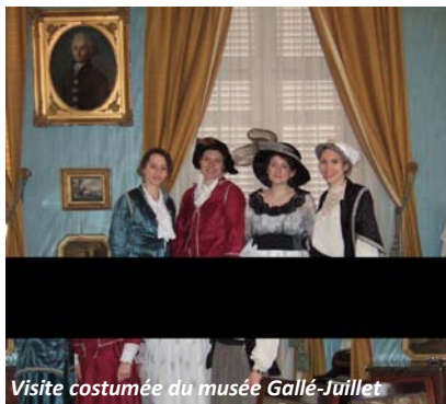
Visite costumée du musée Gallé-Juillet

En participant pour la sixième année consécutive à la Nuit des Musées, le musée Gallé-Juillet propose aux visiteurs de se retrouver à la Belle Epoque, au milieu de ses personnages et de son ambiance particulière. Les visiteurs sont, cette année, invités à assister et à participer au spectacle-jeu donné par les acteurs de la troupe de théâtre l'Art m'attend. En allant à leur rencontre, ils devront tenter de résoudre l'enquête policière afin de découvrir qui a volé les bijoux de Madame Gallé. Après avoir mené l'enquête, ils seront invités à danser, dans l'espace de la salle des gardes, sur des airs populaires, au son de l'orgue de barbarie dit « Le zinzin » de Fanny et Antoine.