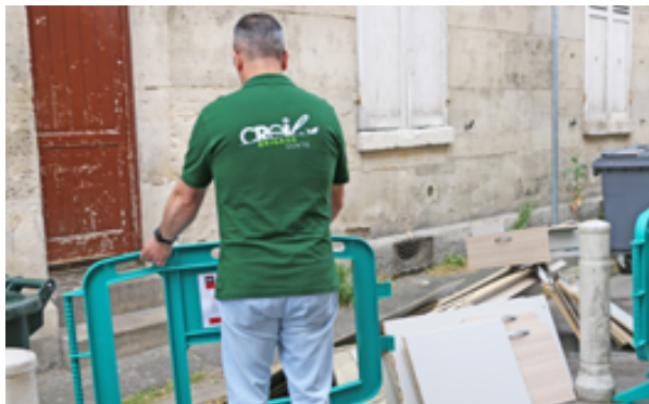
Découverte d'un dépôt sauvage, la Brigade Verte agit pour verbaliser les incivilités.

Depuis le printemps dernier, la Brigade Verte traque les dépôts sauvages et toutes les incivilités liées à la pollution urbaine. Si la prévention et le dialogue avec les contrevenants sont de mise, ces agents sont aussi amenés à verbaliser les réfractaires. Et ils se donnent les moyens de remonter jusqu'aux pollueurs en enquêtant.