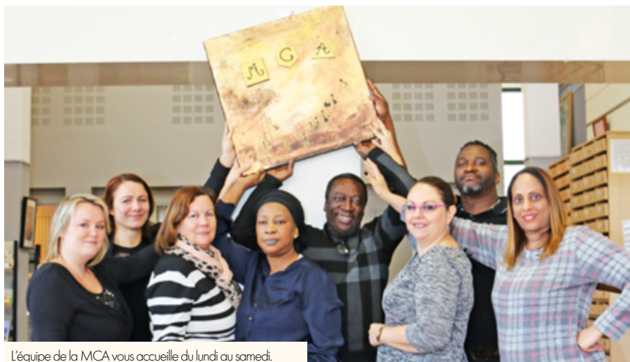
L'équipe de la MCA vous accueille du lundi au samedi.

La vie associative contribue au dynamisme d'une ville. Un adage particulièrement vrai pour Creil qui compte pas moins de 293 associations. Fidèle à ses valeurs, la municipalité a décidé de soutenir les associations en lançant des sessions de formation gratuites. Zoom sur cette nouveauté !