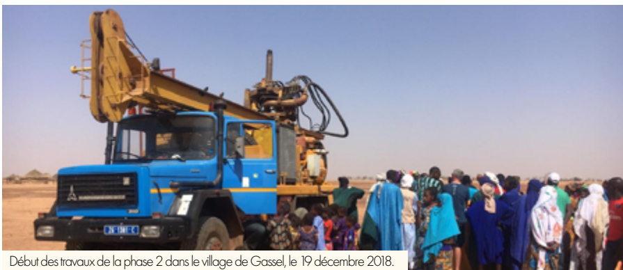
Début des travaux de la phase 2 dans le village de Gassel, le 19 décembre 2018.

Très développée par les élus dans la commune, la solidarité Creilloise s'exporte. Exemple avec des travaux d'eau et d'assainissement menés dans des villages du Sénégal grâce aux financements de l'Agence de l'eau, des villes de Nabadji et Creil, de l'Office de forages ruraux ainsi que de l'Agglomération Creil Sud Oise.