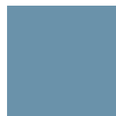
RAL 5014 Bleu pigeon