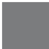
RAL 7037 Gris poussière