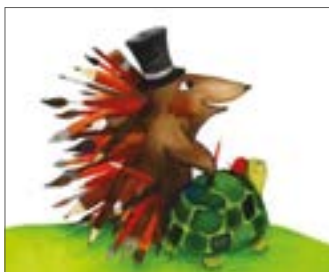
Le spectacle Kiko, de Laurent CONTAMIN, initialement prévu à la médiathèque JP Besse sera finalement joué dans une école.

Les médiathèques ont décidé d'aller à la rencontre de leurs publics et de transporter leurs animations «Hors les murs» dans les structures de la Ville. C'est ainsi que dans le cadre de la Semaine de la langue française et de la francophonie , les écoles et centres de loisirs de Creil vont accueillir des ateliers d'écriture, d'illustration et de création de comptines, ainsi que des spectacles de contes.