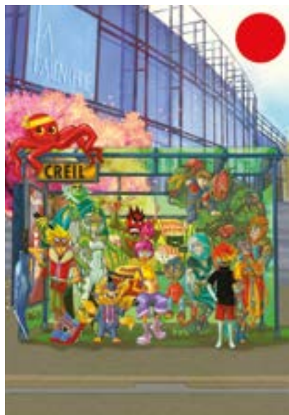
Auteurs du visuel : Sylvain Rumello et Yann Vilain Cortie

Sinath, auteure Manga sera présente dans les établissements scolaires de la Ville les mardi, jeudi et vendredi de la semaine.