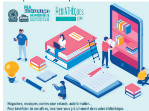
Magazines, musiques, contes pour enfants, actualités... Pour bénéficier de ces offres, inscrivez-vous gratuitement dans votre bibliothèque.

» Médiathèque A. Chanut Atelier de découverte de nos nouvelles ressources numériques proposées, en partenariat avec la Médiathèque Départementale de l'Oise, accessibles 24h/24 : presse et magazines, contes interactifs, concerts à la carte, webradios, mais aussi réviser, apprendre, développer ses compétences, emprunt de livres numériques... Sur inscription dans la limite des places disponibles.