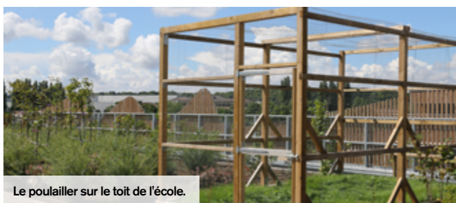
Le poulailler sur le toit de l'école.

matique du bâtiment, dès l'entrée, la serre aux papillons accueille les visiteurs dans un environnement agréable et original. C'est aussi d'un point de vue énergétique que l'établissement fait preuve d'innovation. Ainsi, la crèche est équipée d'un plancher chauffant, les salles de classes, la restauration et la salle polyvalente disposent de panneaux rayonnants basse température au plafond. Enfin, l'établissement dispose d'un système de chauffage durable. Sur le toit, les enfants vont pouvoir s'adonner à l'entretien d'un jardin pédagogique et planter leurs propres légumes dans le jardin potager. Les petits Creillois pourront également découvrir les