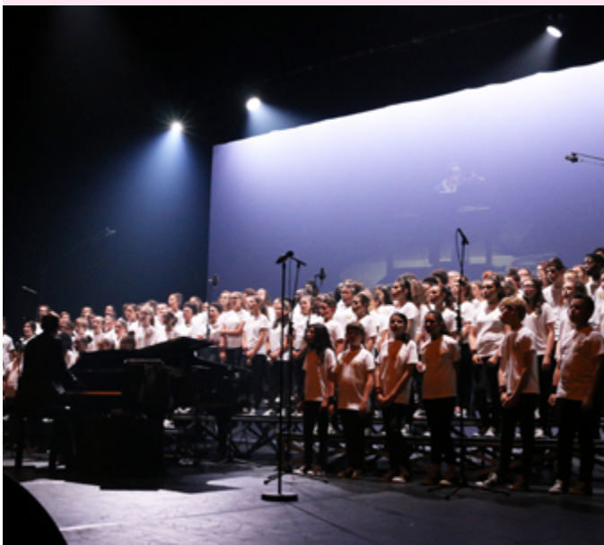
Le Chœur des Collégiens du Conservatoire de Creil dit « C4 » ont fêté les 10 ans d'une belle aventure lors d'un concert réunissant toutes les générations.