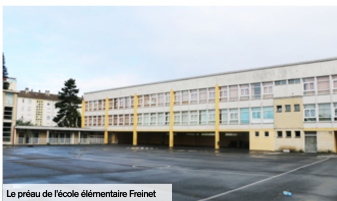
Le préau de l'école élémentaire Freinet

i Direction Générale des Services Techniques 03 44 29 51 04 direction.services.techniques@mairie-creil.fr