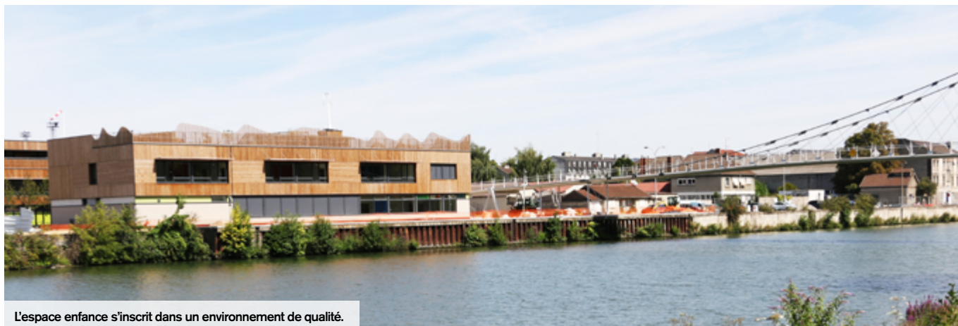
L'espace enfance s'inscrit dans un environnement de qualité.

C'est une nouvelle étape majeure dans la mue qu'opère notre ville. Après le grand plan de rénovation du quartier Rouher et parallèlement à celui à venir du quartier du Moulin et plus largement des Hauts de Creil, le quartier Gournay-Les-Usines se pare à son tour d'un équipement innovant et exemplaire à bien des titres.