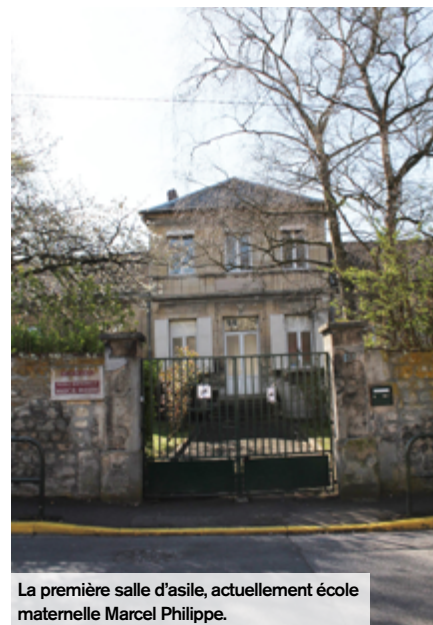
La première salle d'asile, actuellement école maternelle Marcel Philippe.

Les tout-petits, c'est-à-dire les enfants âgés entre deux et cinq ans, étaient accueillis dans les «salles d'asile», qui deviendront par la suite des écoles maternelles.