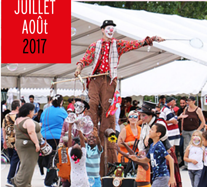
Stands, expositions, démonstrations, initiations, animations pour petits et grands se sont succédés tout au long de la journée.

Visite spéciale de Ndaba Mandela - Passerelle Nelson Mandela - 19 juin Fête des associations - Île Saint-Maurice - 25 juin Concert spécial 10 ans des C4 - Théâtre de la Faïencerie - 2 juillet Creil, bords de l'Oise - Parc municipal de la Faïencerie - du 8 juillet au 15 août