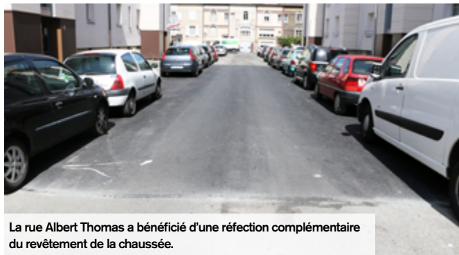
La rue Albert Thomas a bénéficié d'une réfection complémentaire du revêtement de la chaussée.

Les équipes de la Ville de Creil et ses prestataires interviennent chaque jour pour entretenir, sécuriser et aménager l'espace public. En plus des interventions quotidiennes, travaux et chantiers réalisés cet été, servent à améliorer le cadre de vie des Creillois, et aux personnes à mobilité réduite (PMR), de se déplacer facilement.