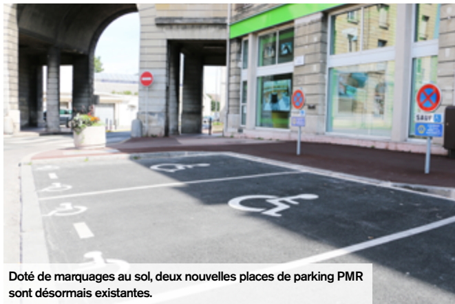
Doté de marquages au sol, deux nouvelles places de parking PMR sont désormais existantes.

Pour l'école élémentaire Freinet, c'est le revêtement au sol du préau qui a été entièrement refait.