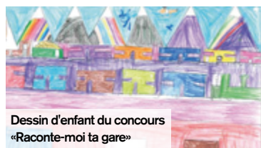
Dessin d'enfant du concours «Raconte-moi ta gare»

Autour de l'ambitieux projet «Gare, Cœur d'Agglo», l'ensemble du quartier de la gare de Creil va petit à petit se remodeler sur près de 270 hectares, créant un pôle urbain dynamique qui