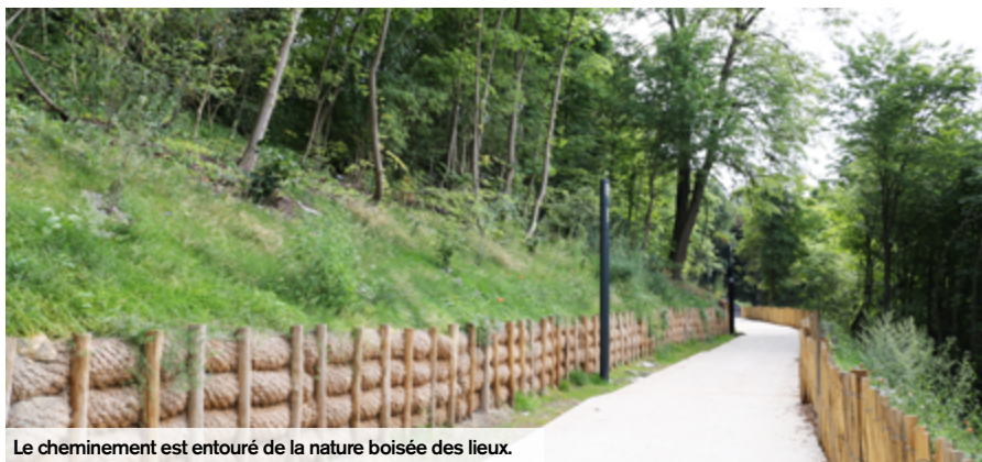
Le cheminement est entouré de la nature boisée des lieux.

Rattachement symbolique fort et désormais visible, une liaison douce éclairée et accessible aux personnes à mobilité réduite sera achevée au début de l'automne. Elle permettra de rejoindre le quartier Rouher et le centre-ville jusqu'à la gare en toute sécurité.