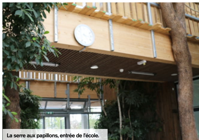
La serre aux papillons, entrée de l'école.

Avec sa structure et sa façade en bois naturel, le bâtiment est indéniablement un lieu reconnaissable et identifiable. Élément emblé-