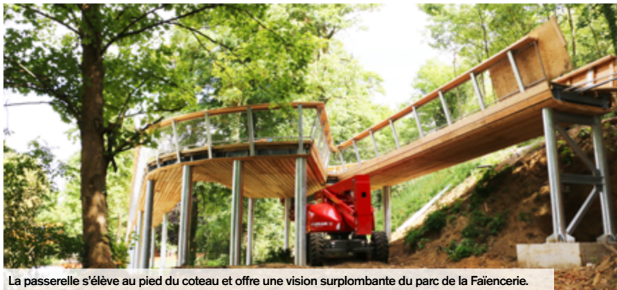
La passerelle s'élève au pied du coteau et offre une vision surplombante du parc de la Faïencerie.

Les piétons et les cyclistes habitués à se rendre du quartier Rouher au centre-ville ou à la gare de Creil vont pouvoir désormais emprunter un cheminement, long de 1 250 mètres, construit à flanc de coteau.