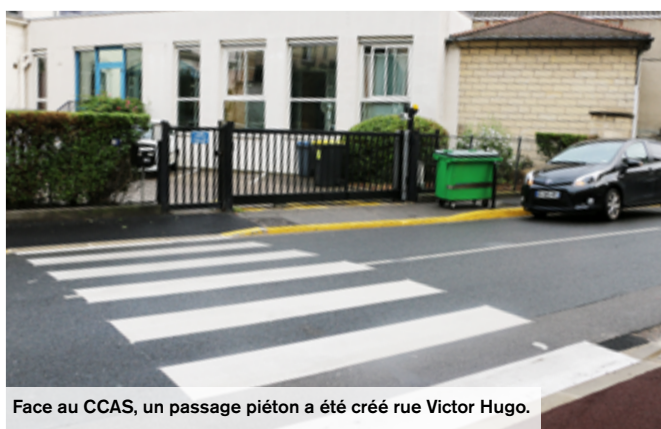
Face au CCAS, un passage piéton a été créé rue Victor Hugo.

i Direction Générale des Services Techniques 03 44 29 51 04 direction.services.techniques@mairie-creil.fr