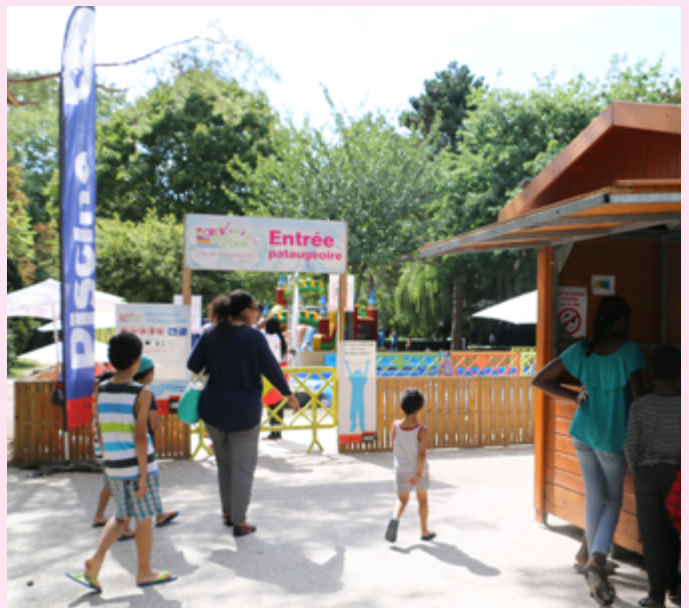
Creil, bords de l'Oise a réuni de nombreux visiteurs qui ont profité des joies de l'été, entre détente, activités sportives et animations ludiques.