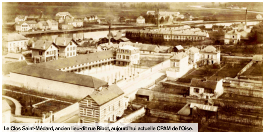
Le Clos Saint-Médard, ancien lieu-dit rue Ribot, aujourd'hui actuelle CPAM de l'Oise.

En cette période de rentrée des classes, Creil Maintenant a voulu vous faire découvrir la plus ancienne école de la ville: l'école de la rue Ribot. Aujourd'hui disparue, elle abrite la Caisse Primaire d'Assurance Maladie de l'Oise.