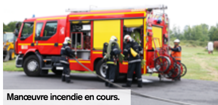
Manœuvre incendie en cours.

Envie de s'engager au service des autres ? Découvrez le quotidien de sapeurs-pompiers volontaires engagés aux côtés des professionnels du Centre de secours principal de Creil.