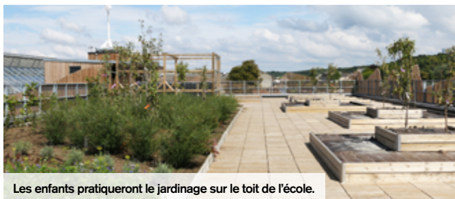
Les enfants pratiqueront le jardinage sur le toit de l'école.

matique du bâtiment, dès l'entrée, la serre aux papillons accueille les visiteurs dans un environnement agréable et original. C'est aussi d'un point de vue énergétique que l'établissement fait preuve d'innovation. Ainsi, la crèche est équipée d'un plancher chauffant, les salles de classes, la restauration et la salle polyvalente disposent de panneaux rayonnants basse température au plafond. Enfin, l'établissement dispose d'un système de chauffage durable. Sur le toit, les enfants vont pouvoir s'adonner à l'entretien d'un jardin pédagogique et planter leurs propres légumes dans le jardin potager. Les petits Creillois pourront également découvrir les