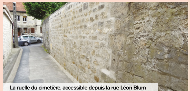
La ruelle du cimetière, accessible depuis la rue Léon Blum

Des travaux de réfection de la chaussée de la rue Aristide Briand et de la voie parallèle à la rue Marie et Pierre Curie ont été réalisés.