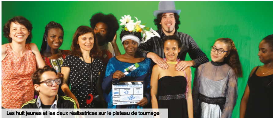
Les huit jeunes et les deux réalisatrices sur le plateau de tournage

Durant la période estivale, huit jeunes Creillois ont participé à la web-série « Where is the king ? ». Sélectionnés après un casting où plus de 250 selfies-vidéo ont été reçus, ils se sont essayés à l'écriture de scénario, en passant par la réalisation et le jeu d'acteur, avec l'aide de deux professionnelles. L'histoire se déroule autour de Maurice Gallé, mort il y a 100 ans, et son fantôme. C'est une intrigue loufoque et comique, mêlant l'histoire de Creil et de son château, et anecdotes réelles vécues par les jeunes