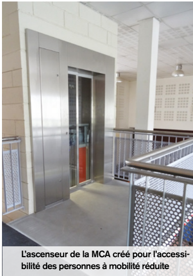
L'ascenseur de la MCA créé pour l'accessibilité des personnes à mobilité réduite

Des travaux de rénovation et d'accessibilité ont été effectués à la médiathèque Antoine Chanut et à la Maison Creilloise des Associations pour accueillir dans de meilleures conditions le public.