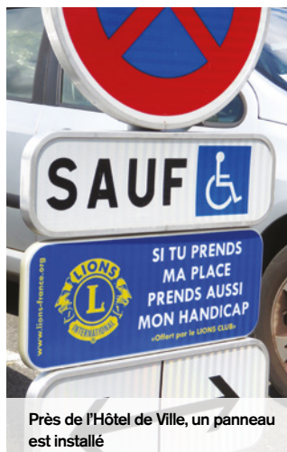
Près de l'Hôtel de Ville, un panneau est installé

En mai, plusieurs membres du Lions-Club de Senlis Trois Forêts étaient à Creil pour officialiser la pose de 40 plaques qu'ils ont offertes à la municipalité. Portant l'inscription «Si tu prends ma place, prends aussi mon handicap», elles complètent les panneaux matérialisant les places réservées aux handicapés dans plusieurs lieux de la ville. À Creil, 254 places sont prévues pour les personnes en situation de handicap. Des places trop souvent occupées par des automobilistes manquant de civisme.