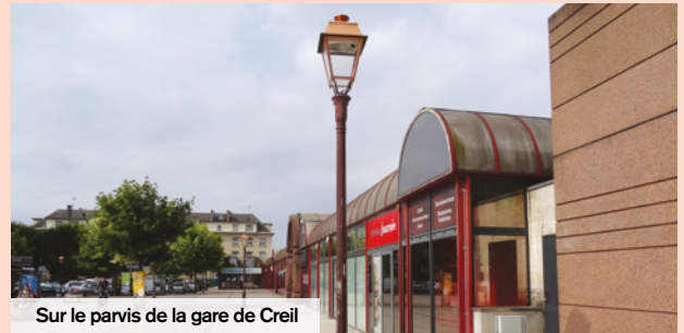
Sur le parvis de la gare de Creil

L'environnement et le cadre de vie constituent une priorité forte pour l'équipe municipale.