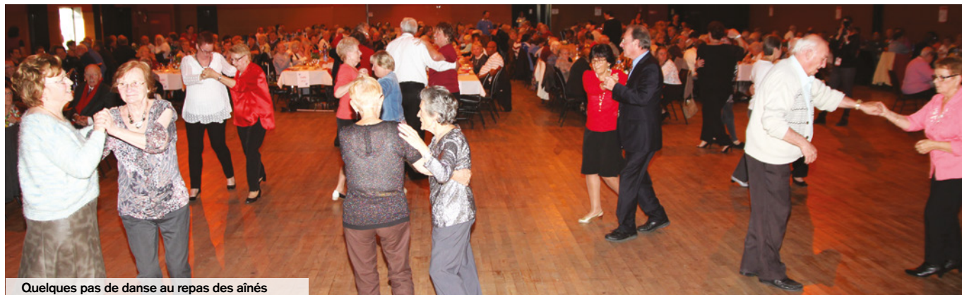
Quelques pas de danse au repas des aînés