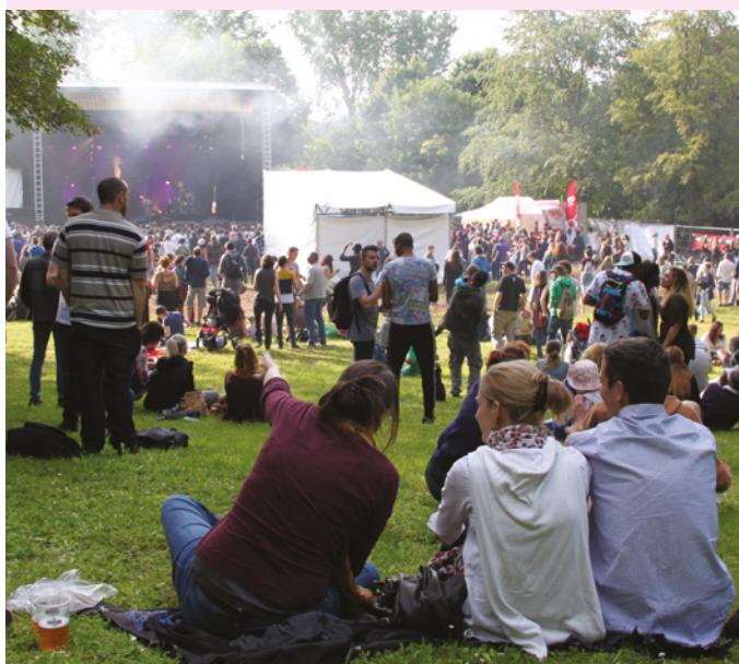
La foule s'était rassemblée pour profiter d'un tour du monde musical en plein cœur de la ville.