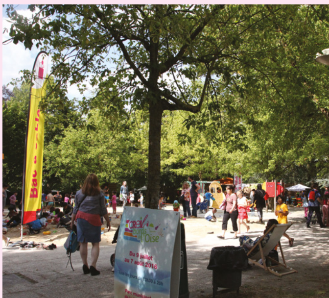
Comme chaque année, «Creil, Bords de l'Oise» rencontre un franc succès auprès des jeunes.