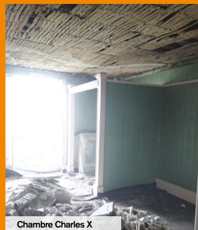
Chambre Charles X

Le plafond de la chambre Charles X du musée Gallé-Juillet présentait un affaissement de plusieurs centimètres. Cette pièce a été fermée le temps des travaux, pour permettre au public de redécouvrir le mobilier et les objets, tout en respectant la configuration d'origine de la salle. La peinture des volets de la Maison de la Faïence a également été réalisée.