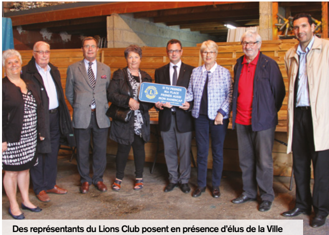
Des représentants du Lions Club posent en présence d'élus de la Ville

En mai, plusieurs membres du Lions-Club de Senlis Trois Forêts étaient à Creil pour officialiser la pose de 40 plaques qu'ils ont offertes à la municipalité. Portant l'inscription «Si tu prends ma place, prends aussi mon handicap», elles complètent les panneaux matérialisant les places réservées aux handicapés dans plusieurs lieux de la ville. À Creil, 254 places sont prévues pour les personnes en situation de handicap. Des places trop souvent occupées par des automobilistes manquant de civisme.