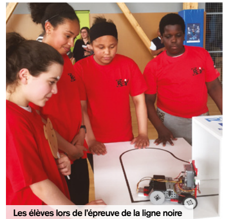
Les élèves lors de l'épreuve de la ligne noire

Le 8 juin dernier, s'est déroulé la deuxième édition du Défi Robot à Beauvais. Ce projet qui mettait en compétition sept collèges de l'Oise a permis aux élèves de 6 e au collège Jean-Jacques Rousseau de Creil, d'exploiter le thème de la robotique en cours de technologie.