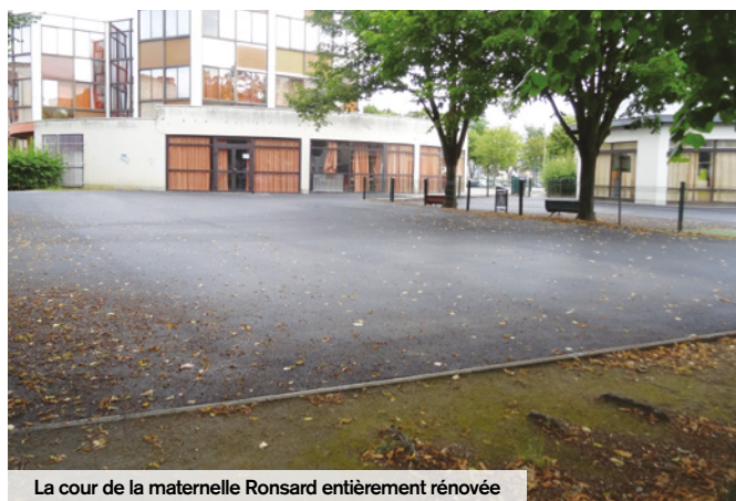
La cour de la maternelle Ronsard entièrement rénovée

Comme chaque été, des travaux ont eu lieu dans les écoles afin que les petits Creillois bénéficient de bonnes conditions d'accueil dès le 1 er septembre.