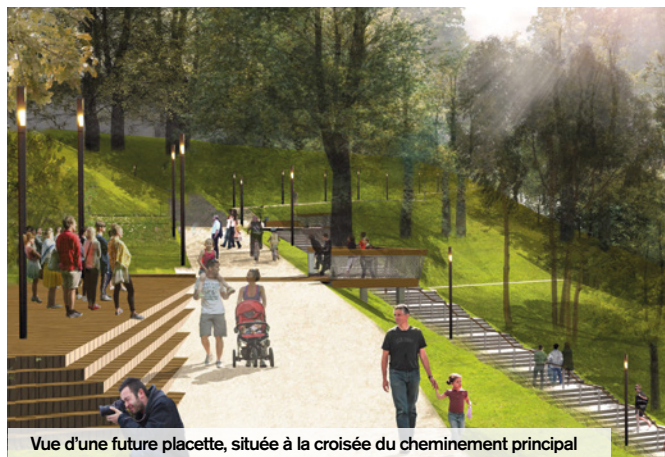
Vue d'une future placette, située à la croisée du cheminement principal

Favorable à la circulation sécurisée des piétons et des vélos, la liaison douce appelée « l'Allée à Cricri » va sortir de terre. À l'automne 2017, elle reliera le quartier Rouher, le centre-ville de Creil et le cœur de l'agglomération via la passerelle sur l'Oise Nelson-Mandela.