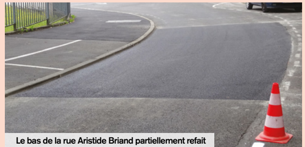
Le bas de la rue Aristide Briand partiellement refait

Durant l'été, la Ville a poursuivi la modernisation de l'éclairage public aux abords de la gare. En effet, ce ne sont pas moins de 27 luminaires vétustes qui ont été remplacés par des lanternes, et ce, afin d'assurer la sécurité des piétons et usagers de la route.