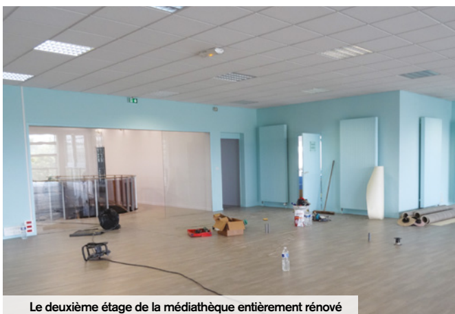
Le deuxième étage de la médiathèque entièrement rénové

places assises de la salle de spectacle, création d'espaces d'attente sécurisés ou encore réaménagement des sanitaires, la MCA a été entièrement mise aux normes afin d'accueillir au mieux les personnes à mobilité réduite.