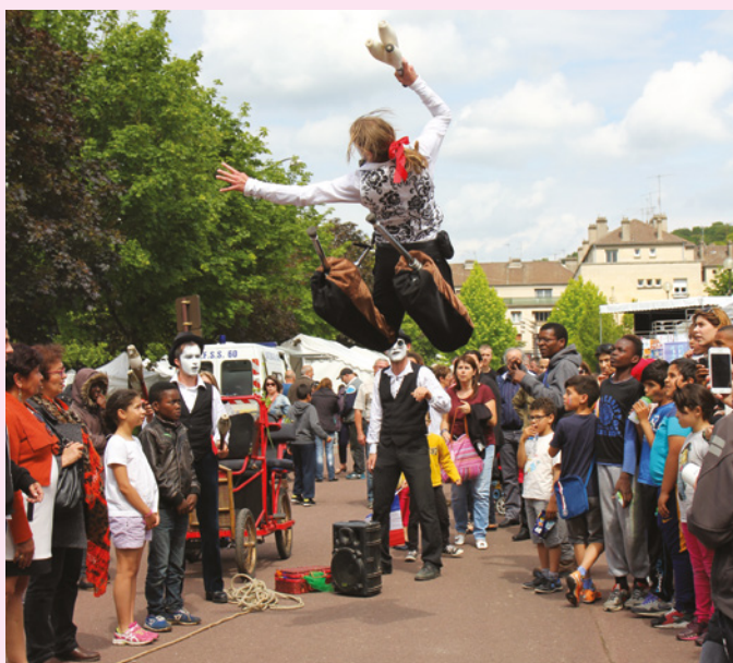
Autour de la centaine d'associations présentes, le public a profité d'un spectacle déambulatoire et des diverses animations de danse et musique.