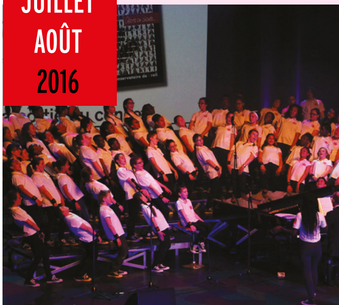
Avec un vaste répertoire s'étendant de la variété française à la pop internationale, et des airs traditionnels, le chœur des C4 a fait salle comble.

Creil, Bords de l'Oise - Parc municipal de la Faïencerie - du 9 juillet au 7 août