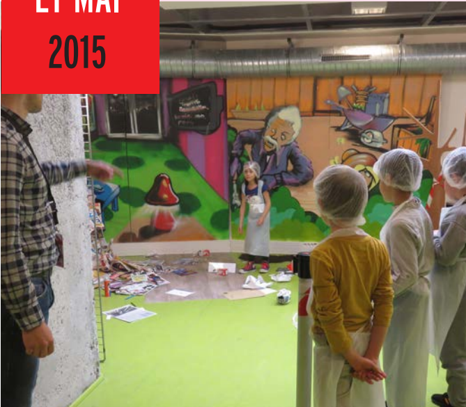
Animation «enquête sur le climat» avec des enfants lors des Temps d'Activités Périscolaires, 3 avril 2015 à la Maison de la Ville

Commémoration du 70 e anniversaire du 8 mai 1945 - Monument de la Paix