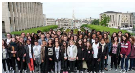
Les C4 en visite à Bruxelles

Pour le plaisir de chanter, les C4 ont eu l'honneur de participer à un échange interculturel mais aussi...royal !