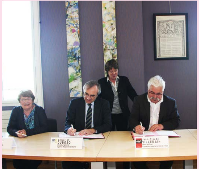
Le Contrat Local de Santé signé par la Région, l'ARS, la Sous-préfecture et la Ville pour améliorer la situation sanitaire