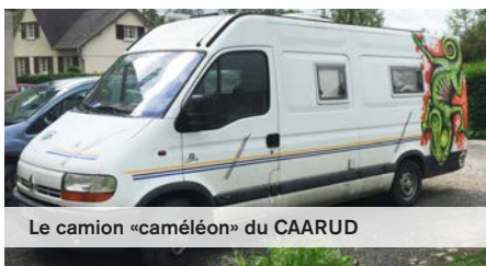
Le camion «caméléon» du CAARUD

Depuis 1983, l'association SATO-Picardie apporte aide et soutien aux personnes toxicomanes sur Creil et les environs. Le Centre d'Accueil et d'accompagnement à la réduction des risques pour usagers de drogues (CAARUD), service attaché à l'association, dispose d'un camion qui sillonne les rues de Creil à la rencontre des usagers de drogue.