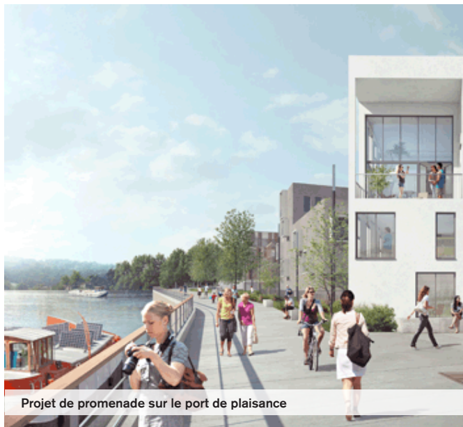
Projet de promenade sur le port de plaisance

Par délibération en date du 9 mars 2015, le Conseil municipal de Creil a donné son accord pour le dossier de création de la Zone d'Aménagement Concerté dénommée «ZAC éc'eau port fluvial», dont la vocation est la requalification de la friche industrielle dite Vieille Montagne située en plein cœur de la Ville.