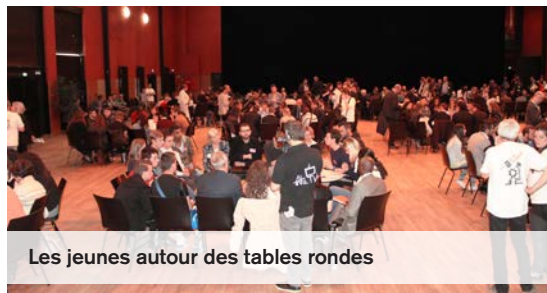
Les jeunes autour des tables rondes

Creil, est une Ville jeune dont plus de 40 % de la population a moins de 30 ans. C'est dans une démarche de démocratie participative que la municipalité s'est engagée, à travers le travail mené avec le Conseil Intercommunal de Sécurité et de Prévention de la Délinquance (CISPD) pour la lutte contre l'absentéisme et le décrochage scolaire, et la formation sur les compétences demandées sur le bassin creillois. Les maisons de quartier présentes à Creil montrent que les jeunes veulent s'investir et la municipalité est présente pour les accompagner.