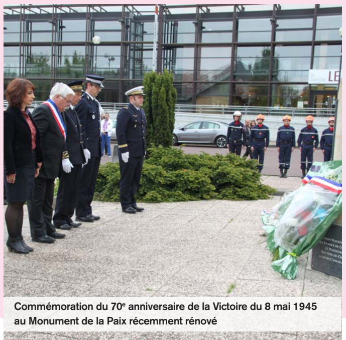
Commémoration du 70 e anniversaire de la Victoire du 8 mai 1945 au Monument de la Paix récemment rénové