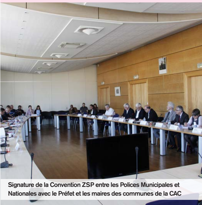
Signature de la Convention ZSP entre les Polices Municipales et Nationales avec le Préfet et les maires des communes de la CAC