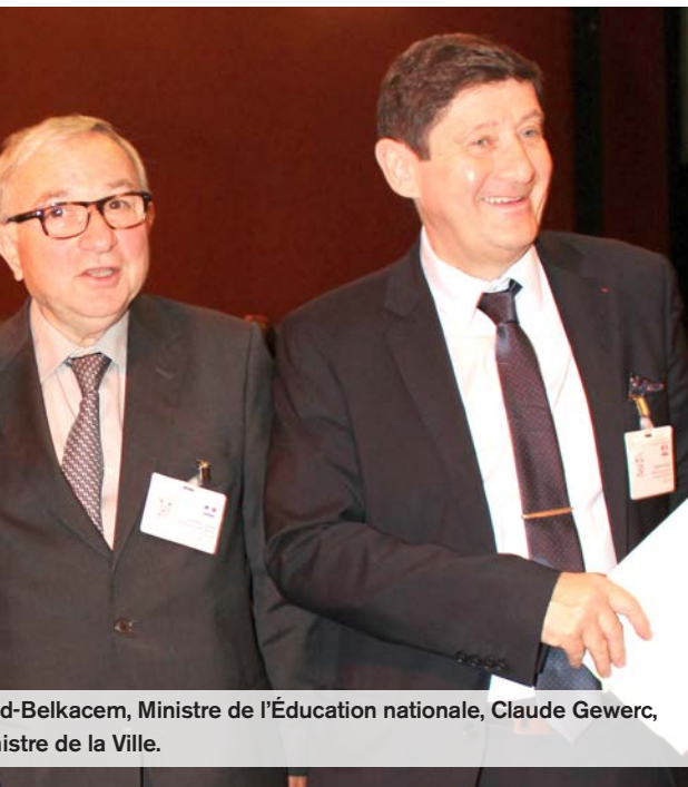
Najat Vallaud-Belkacem, Ministre de l'Éducation nationale, Claude Gewerc, Maire de la Ville.