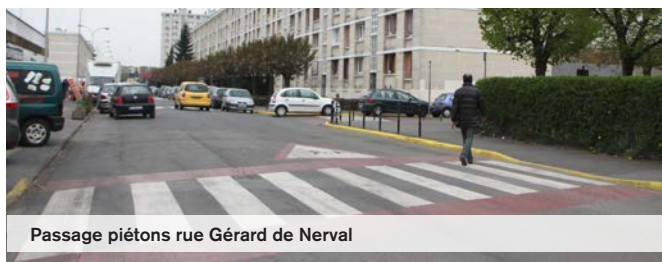
Passage piétons rue Gérard de Nerval

L'entretien et le rafraîchissement des peintures de la signalisation au sol assurent la sécurité des piétons. Pour répondre à la demande des habitants du quartier Rouher, les services municipaux ont réalisé le marquage au sol aux abords des écoles de la rue Gérard de Nerval. C'est une nouvelle opération de la municipalité pour protéger les citoyens dans cet espace.