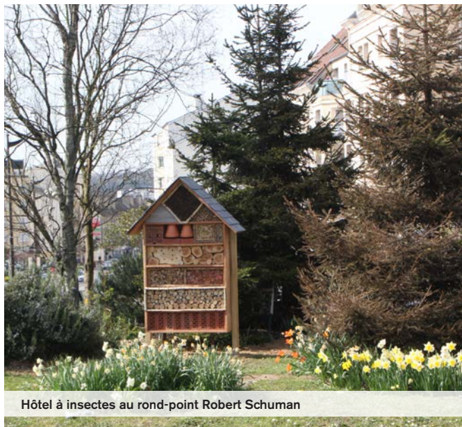
Hôtel à insectes au rond-point Robert Schuman

On connaît bien les nichoirs pour les oiseaux, mais les insectes eux aussi ont droit à des hôtels ! Ces abris naturels (bois, paille, glaise...) permettent de reconstituer l'habitat des insectes, qui pollinisent ou qui se nourrissent des espèces nuisibles comme les pucerons. Pour enrichir la biodiversité et contribuer à la conservation de la nature en ville, plusieurs hôtels à insectes ont été installés. Vous retrouverez ces petites maisons au rond-point Robert Schuman, à la sortie de la Ville, boulevard Salvador Allende, mais aussi dans les jardins de la Maison Creilloise des Associations et du Musée Gallé-Juillet. D'autres hôtels à insectes sont également en projet.