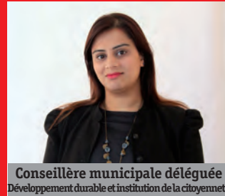
Conseillère municipale déléguée Développement durable et institution de la citoyenneté