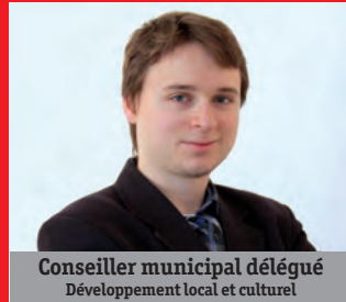
Conseiller municipal délégué Développement local et culturel

Groupe «Élus socialistes et républicains»