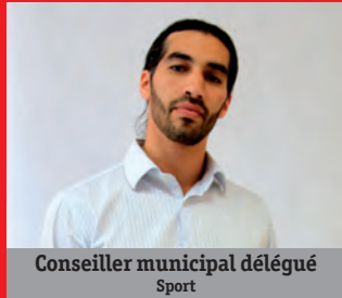
Conseiller municipal délégué Sport