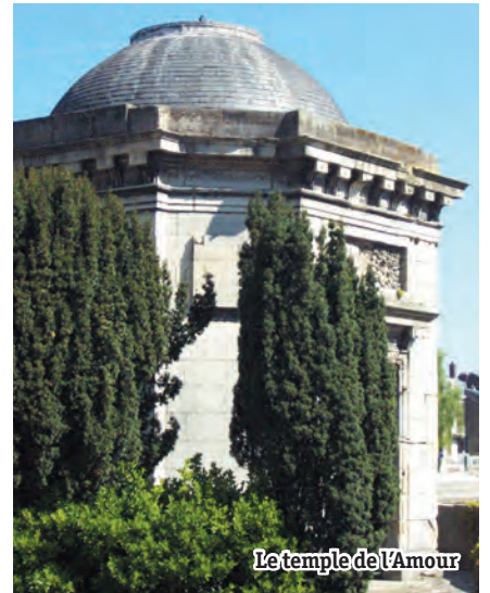
Le temple de l'Amour

i Maison du Tourisme de l'Agglomération Creilloise 41 place du général de Gaulle tél : 03 44 55 16 07 maisondutourisme@agglocreilloise.fr