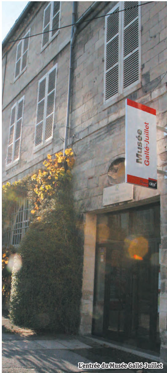
L'entrée du Musée Gallé-Juillet

Le guide de visite et la nouvelle application du musée Gallé-Juillet seront inaugurés lors de la Nuit des musées.