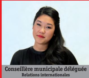
Conseillère municipale déléguée Relations internationales