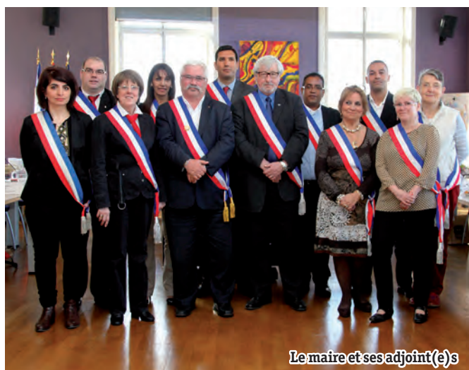
Le maire et ses adjoint(e)s

Il faut collectivement veiller à la bonne gestion de la Ville, et travailler ensemble à apporter les réponses les plus justes et les plus adaptées aux enjeux qui s'annoncent pour Creil, ville en croissance, étoile ferroviaire et locomotive de la première aire urbaine de Picardie au Sud de l'Oise.