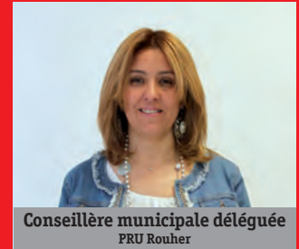
Conseillère municipale déléguée PRU Rouher

Groupe «Élus socialistes et républicains»