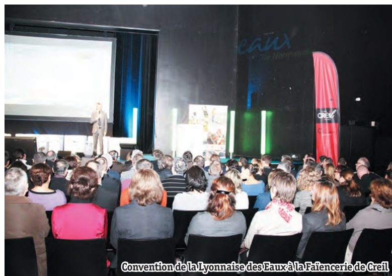
Convention de la Lyonnaise des Eaux à la Faïencerie de Creil

La Lyonnaise des Eaux fait aujourd'hui partie intégrante du paysage creillois et continue d'être une source d'emploi pour ses habitants.