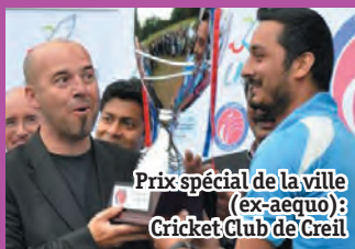
Prix spécial de la ville (ex-aequo): Cricket Club de Creil