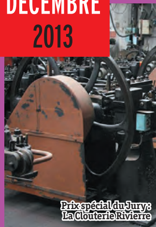
Prix spécial du Jury: La Clouterie Rivière