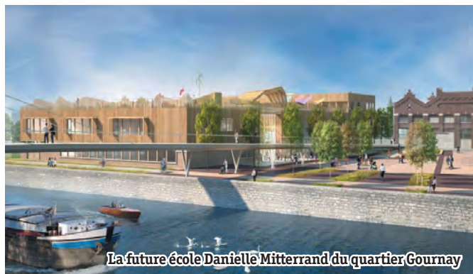
La future école Danielle Mitterrand du quartier Gournay

i Mission Politique de la ville et renouvellement urbain 03 44 29 50 19