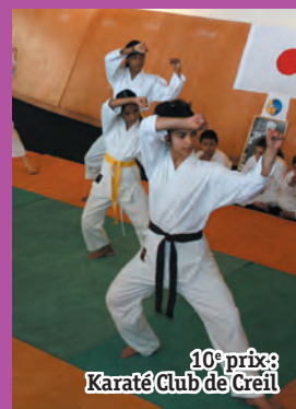
10 e prix: Karaté Club de Creil