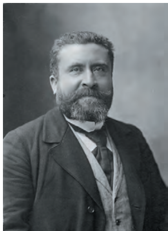
Jean Jaurès en 1904