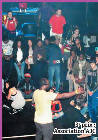
3 e prix: Association AJC