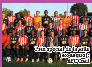
Prix spécial de la ville (ex-aequo): AFC Creil