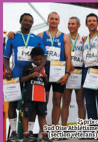
2 e prix: Sud Oise Athlétisme (section vétérans)