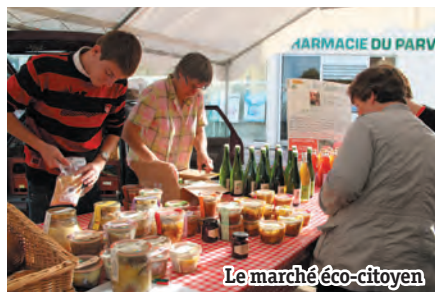
Le marché éco-citoyen

Ne manquez pas les prochains marchés éco-citoyens qui se dérouleront jeudi 13 février et jeudi 13 mars 2014 à partir de 17h30 sur la place Saint-Médard.