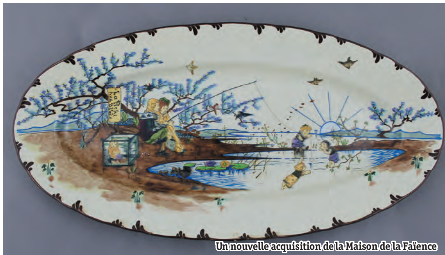
Un nouvelle acquisition de la Maison de la Faïence

i Musée Gallé-Juillet Place François Mitterrand 03 44 29 51 50 musee@mairie-creil.fr