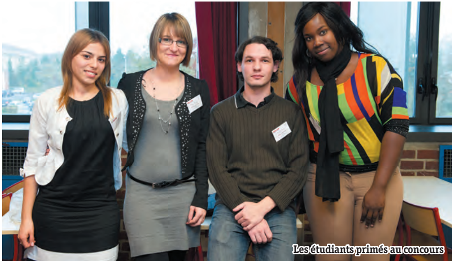
Les étudiants primés au concours

L'Ordre des experts-comptables Picardie Ardennes et la Compagnie Régionale des Commissaires aux Comptes d'Amiens ont organisé la 2 ème édition du Tournoi de gestion. 7 établissements, représentés chacun par une équipe de 4 étudiants, s'affrontaient sur une journée dans la gestion d'une entreprise virtuelle en situation concurrentielle.