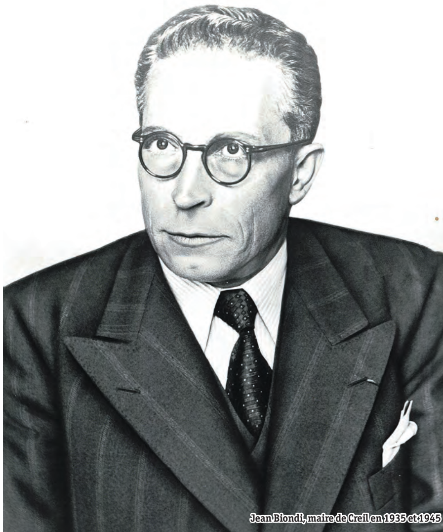
Jean Biondi, maire de Creil en 1935 et 1945