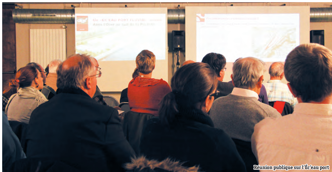
Réunion publique sur l'Éc'eau port

i Direction de la Vie économique, de l'Aménagement et du Développement de la cité Hôtel de Ville - Place François Mitterrand 03 44 29 50 20 - dilvin.arpaci@mairie-creil.fr