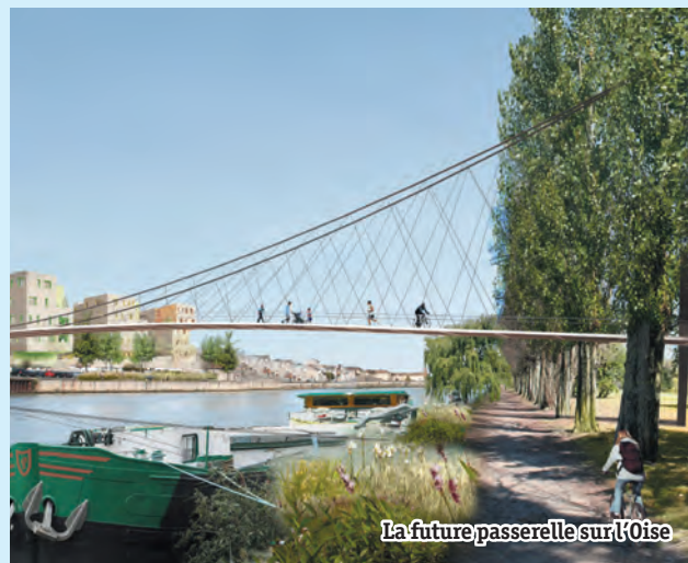
La future passerelle sur l'Oise

La passerelle piétons-cycles au-dessus de l'Oise prend naissance sur l'île Saint-Maurice, dont la requalification est à l'étude, pour aboutir sur une nouvelle place publique sur le quai d'Aval. La visibilité de cette passerelle depuis des points très éloignés a été prise en compte dans sa conception et son image.