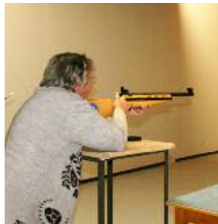
Concours de tir organisé en partenariat avec le club de tir à l'occasion de la dernière édition de la Semaine bleue en 2008.

Pour la 4 e année consécutive, la ville de Creil et le CCAS souhaitent participer à la Semaine Bleue, qui se déroulera courant octobre 2009.