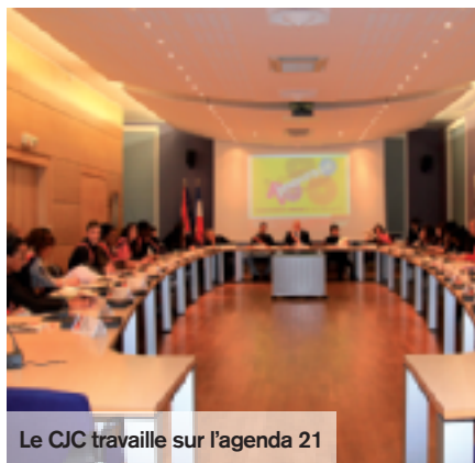
Le CJC travaille sur l'agenda 21

Creil se lance dans une démarche audacieuse, originale en termes de développement durable : remettre de l'humain au cœur de notre société grâce à l'agenda 21. Il est conçu sur mesure au contexte de la ville et en fonction des préoccupations des habitants pour assurer le mieux vivre ensemble.