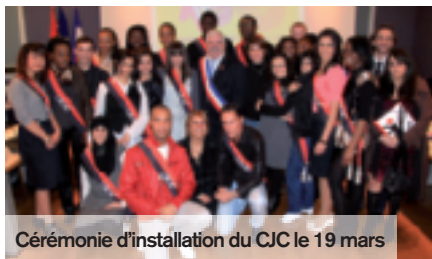
Cérémonie d'installation du CJC le 19 mars

Le 19 mars dernier, les jeunes conseillers de la ville de Creil ont pris officiellement leurs fonctions. La cérémonie s'est déroulée en présence du maire, des élus en charge de la jeunesse, et du parrain de cette instance, le jeune champion de boxe Cédric Vitu. Les jeunes conseillers ont procédé à la signature de la charte et