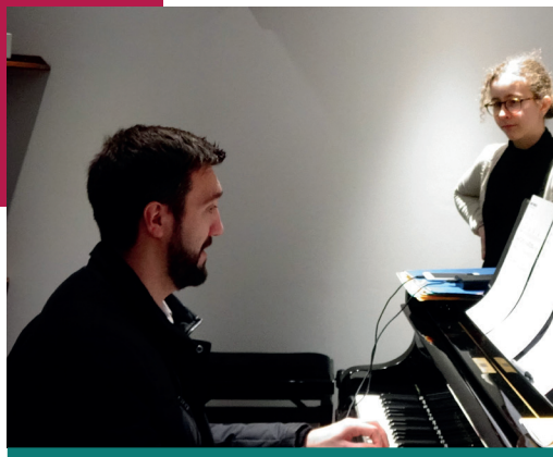
▷ Le chant Ai Adachi