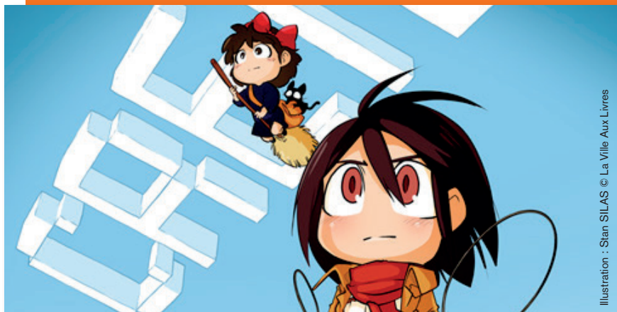
Illustration : Stan SILAS © La Ville Aux Livres