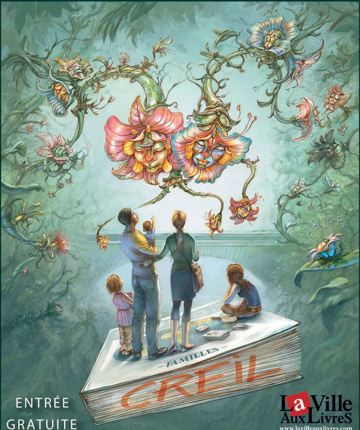
ILLUSTRATION : Thierry SÉGUR