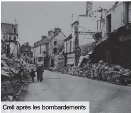
Creil après les bombardements