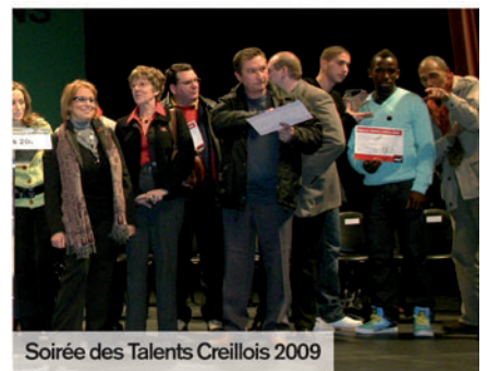
Soirée des Talents Creillois 2009

Vendredi 2 décembre a lieu la cérémonie officielle de remise des prix en présence des élus et des membres du jury. Dans chaque catégorie, les récipiendaires recevront un trophée ainsi qu'une dotation financière pour encourager leurs futurs projets. Le jury décernera également un prix spécial du jury et deux prix spéciaux de la Ville de Creil. Par le biais de cette manifestation sont mis à l'honneur les Creillois qui s'investissent dans une passion, qui s'engagent dans une action particulière. À travers leur réussite, c'est l'ensemble de la Ville de Creil qui est valorisée.