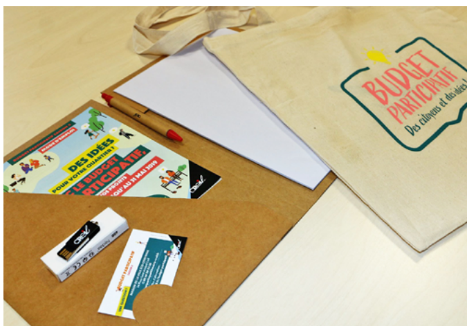
Un kit «porteur de projet» est remis à tous les participants.

Tous les Creillois à partir de 16 ans ont jusqu'au 31 mai 2019 pour manifester leurs intentions, de préférence en groupe, ce qui favorise les échanges entre habitants autour d'un même objectif.