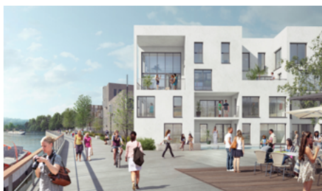
Projection du projet Ec'Eau Port. Photo non contractuelle.

D'ici là, plusieurs ateliers participatifs vont être proposés.