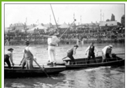
JOUTE À LA LANCE SUR L'OISE > Début du 20 e siècle, Emile Navetier, photographie sur plaque de verre Photo de M. Huguier, Archives municipales de Creil

de réaliser un don mais aussi un prêt à durée déterminée de vos documents.