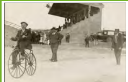
UN HOMME À VÉLO AU STADE-VÉLODROME DE CREIL > Vers 1954, photographie

La collecte d'archives liées au monde du sport est toujours en cours aux archives municipales ! Trois associations et deux particuliers ont permis d'enrichir les fonds municipaux. Particulier ou association sportive creilloise, toutes vos archives nous intéressent, papier ou numérique. Il est possible