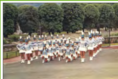
MAJORETTES DE CREIL - 60 > Vers 1990, carte postale

De son côté, le service patrimoine a concocté une exposition de photographies, témoignant de l'histoire du sport à Creil du 19 e au 21 e siècle, issues du fonds du service patrimoine de la ville. Installée sur onze sites dans tous les quartiers de Creil, l'exposition est l'occasion de parcourir les sports de loisirs et de compétition sous toutes leurs formes, la création de structures telles que la piscine et les stades, le développement des associations sportives et les manifesta-