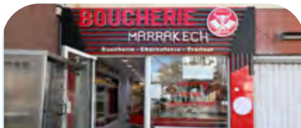
BOUCHERIE MARRAKECH 2 rue Aristide Briand 03 44 71 52 26