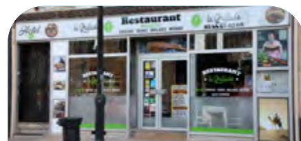
LA GRILLADE RESTAURANT 52 rue Gambetta 03 44 55 03 06