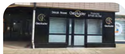
CHEZ KADER Restaurant 32 Place Saint Médard 09 73 21 92