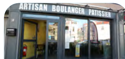
BOULANGERIE D.O 59 rue Gambetta 03 44 73 52 24