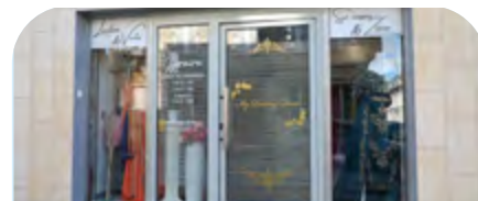
MY LUXURY DRESS Robes de cérémonies - 19 rue Albert Dugué 06 51 26 85 23