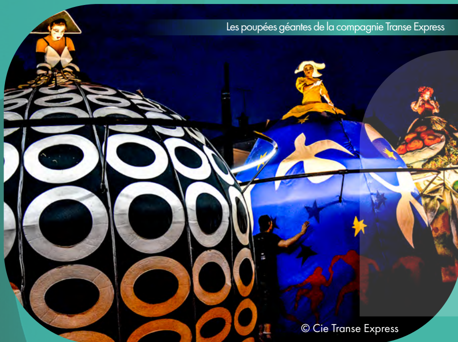
Les poupées géantes de la compagnie Transe Express