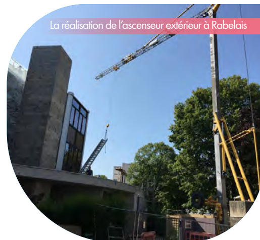
La réalisation de l'ascenseur extérieur à Rabelais