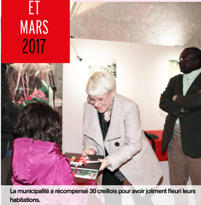
La municipalité a récompensé 30 creillois pour avoir joliment fleuri leurs habitations.

Remise du prix du concours des maisons fleuries - Hôtel de Ville - 4 février Réunion publique budgétaire - Maison de la Ville - 7 mars Rencontre-débat avec Abdenour Bidar - Médiathèque Antoine Chanut - 10 mars Réception en l'honneur de Cédric Vitu - Hôtel de Ville - 13 mars