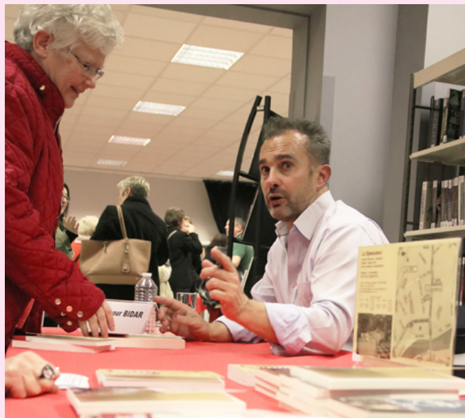
Une soirée de débat suivie de dédicaces s'est tenue avec le philosophe du vivre ensemble, Abdenour Bidar.