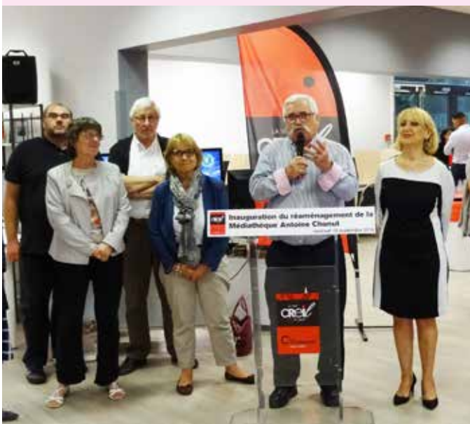
Après trois mois de travaux, la médiathèque Antoine Chanut a réouvert au public en présence du Maire de la Ville et d'élus locaux.