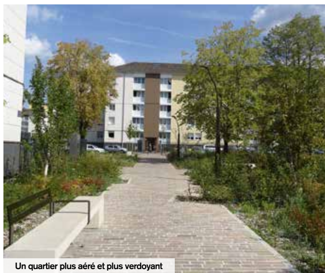
Un quartier plus aéré et plus verdoyant

Les travaux engagés avec l'ANRU dans le quartier Rouher se poursuivent pour continuer à améliorer le cadre de vie des creillois.