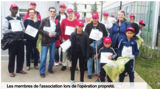
Les membres de l'association lors de l'opération propreté.

Le 1 er octobre, une vingtaine de citoyens avec l'association «Vivre et Agir ensemble» ont mené une opération de ramassage des déchets en lien avec la campagne d'interpellation et de mobilisation autour de la propreté lancée par la municipalité. Symboliquement rassemblés place de la Fraternité (quartier Rouher) et équipés de pinces, sacs, gants, les participants ont sensibilisé les habitants et commerçants pour agir ensemble en faveur de l'amélioration de leur cadre de vie. Leur démarche est soutenue par la Ville qui encourage ces initiatives.