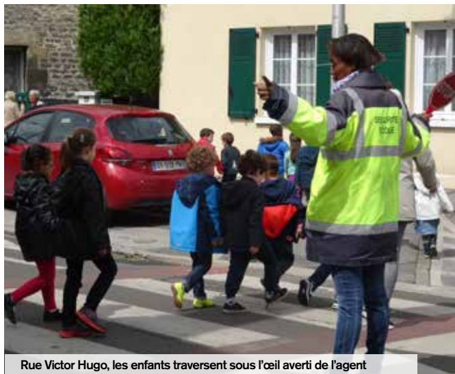
Rue Victor Hugo, les enfants traversent sous l'œil averti de l'agent

Grâce à 19 agents dans toute la ville, les enfants et familles peuvent accéder à leur établissement scolaire en toute sécurité.