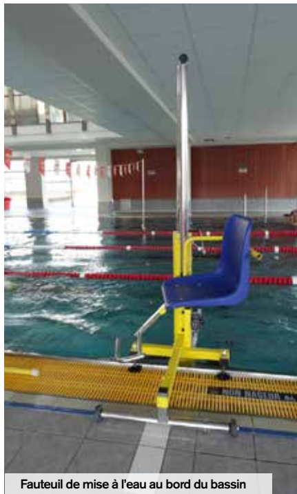
Fauteuil de mise à l'eau au bord du bassin

En dehors des équipements, des cours d'handinage sont dispensés par les éducateurs formés au handisport et des cours de natation donnés aux enfants en situation de handicap. Des conventions sont régulièrement signées avec les établissements comme le SESSAD APF pour le bien-être thérapeutique des jeunes.