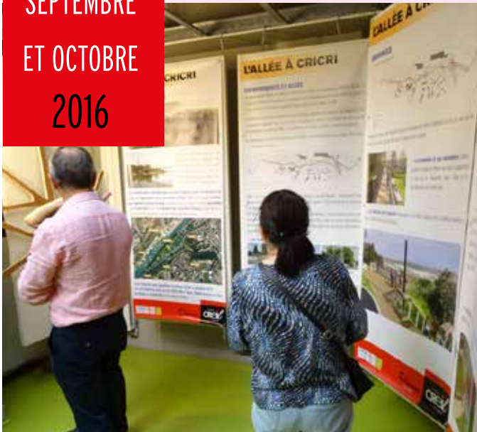
Les Creillois ont découvert le projet d'aménagement de l'Allée à Cricri lors d'une réunion publique.

Présentation du projet d'aménagement de l'Allée à Cricri - Maison de la Ville - 13 septembre Inauguration des travaux de rénovation de la médiathèque Antoine Chanut - 16 septembre Marche santé pour «Octobre Rose» - quartiers du Moulin et Rouher - 4 octobre 4 e Biennale des Arts de la Terre - Espace culturel de la Faïencerie - 8 octobre