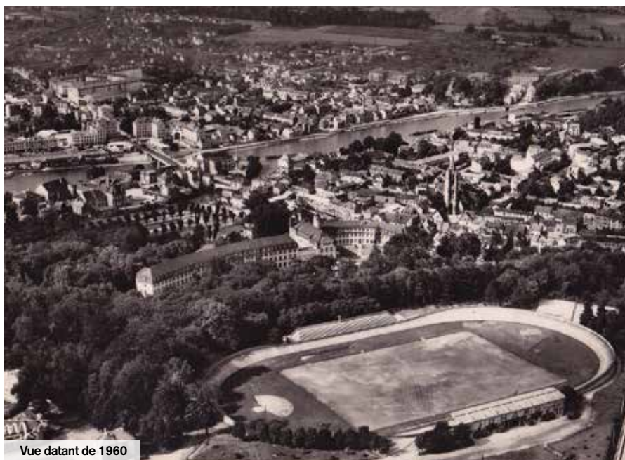
Vue datant de 1960

La Communauté de l'Agglomération Creilloise, autrefois District Urbain de l'Agglomération Creilloise, s'est constituée en 1965. L'histoire de l'Agglomération va évoluer au 1 er janvier 2017 avec l'arrivée des sept villes de la communauté de communes Pierre-Sud-Oise pour former l'Agglomération Creil Sud Oise.