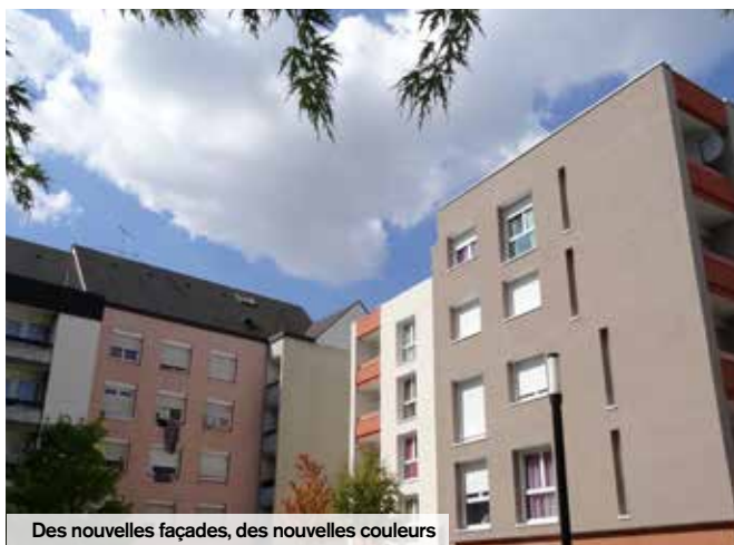
Des nouvelles façades, des nouvelles couleurs

Dans l'attente du prochain programme de rénovation urbaine (ANRU2), la Ville a financé une étude couleur pour les façades du quartier du Moulin. Cette étude a abouti à une charte sur les couleurs qui tient lieu de référence pour la rénovation des façades. C'est sur cette base que Oise Habitat a entamé la réhabilitation de 185 logements situés allées Cézanne, Courbet et Square Monet. Les travaux portent principalement sur l'isolation, le remplacement des portes de hall et l'installation de vidéophonie dans chaque logement. La fin des travaux est prévue en 2017.