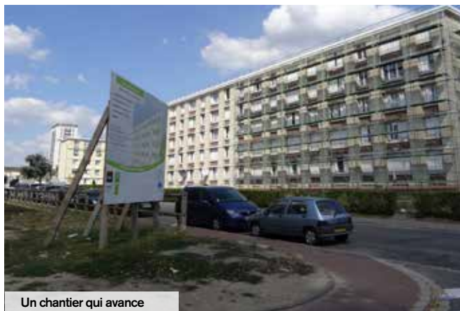
Un chantier qui avance

St Maximin qui revêt les façades. De son côté, la Ville réalisera de nouveaux cheminements piétons pour rejoindre les écoles. Là aussi, ces travaux visent à améliorer la qualité du cadre de vie des habitants. La fin des travaux est prévue en 2018.