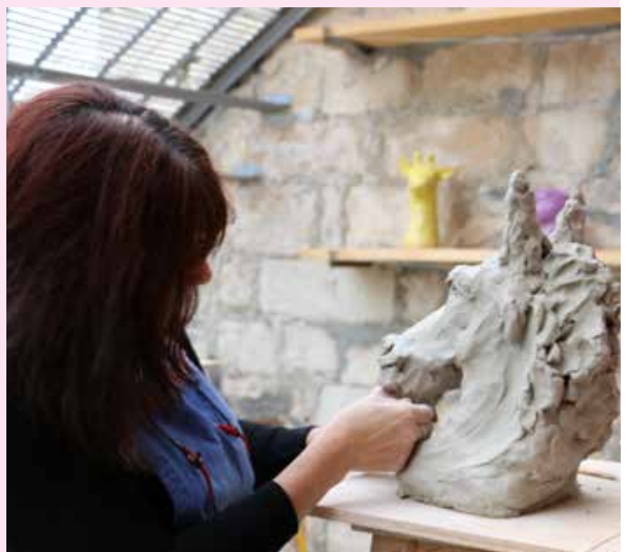
Démonstrations de potiers et ateliers de création ont animé la 4 e Biennale des Arts de la Terre.