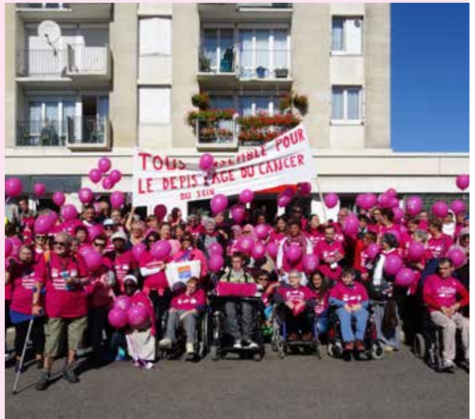
Les agents municipaux, les associations et les habitants se sont mobilisés lors d'une marche pour le dépistage du cancer du sein.