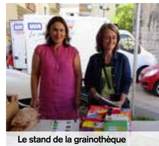
Le stand de la grainothèque

Depuis le début de l'année, l'association Alimentation Locale et citoyenne du Sud Oise (ALCO) est installée sur le marché avec sa grainothèque. L'idée est d'échanger des semences et des plantes sous forme de troc ou don. Cette initiative participative permet à tous ceux qui le souhaitent de cultiver gratuitement toutes sortes de plantes, fleurs, fruits ou légumes, et ainsi de favoriser la présence végétale en ville et la culture de la terre. Il n'est pas obligatoire d'avoir des graines à déposer pour en prendre !