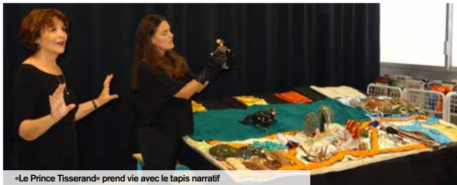
«Le Prince Tisserand» prend vie avec le tapis narratif

Depuis 2015, les médiathèques de Creil travaillent sur des projets de tapis narratifs, supports ludiques d'animation dans le but de favoriser le lien social à travers des contes.