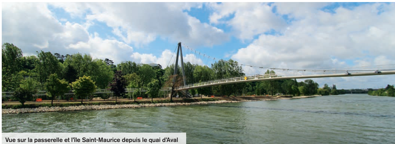
Vue sur la passerelle et l'île Saint-Maurice depuis le quai d'Aval

Au terme de deux ans de travaux, la passerelle qui relie les deux rives de l'Oise en passant par l'île Saint-Maurice ouvrira le samedi 10 octobre. Ce projet de liaison douce montre la modernisation d'un site privilégié de Creil. Rendez-vous pour l'inauguration afin de découvrir les nouveaux aménagements.