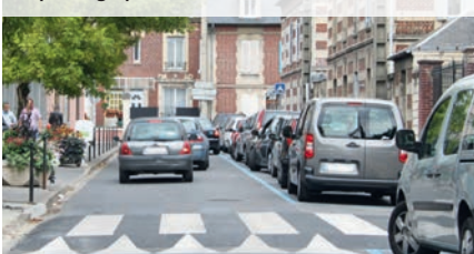
Le passage piéton surélevé rue Ribot

Un passage piéton surélevé a été installé rue Ribot à hauteur de la Caisse Primaire d'Assurance Maladie afin de réduire la vitesse des véhicules.