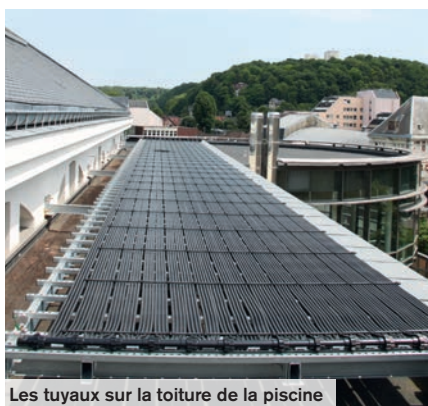
Les tuyaux sur la toiture de la piscine

Cette installation est un nouvel engagement de la Ville de Creil en faveur du développement durable afin d'utiliser les énergies renouvelables tout en réduisant le montant des dépenses énergétiques de la piscine.