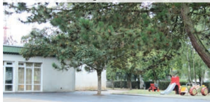
Cour de l'école George Sand

La Ville a la responsabilité des bâtiments des écoles maternelles et élémentaires. Les travaux dans les écoles ont souvent lieu l'été afin de ne pas perturber le fonctionnement interne. De nombreuses opérations ont été menées en 2015 sur différents sites scolaires. Les écoles maternelles Sévigné et Georges Sand ont notamment bénéficié de réfections partielles dans les cours de récréation. L'entretien des peintures, plomberie et travaux de maintenance dans les sanitaires ont été également réalisés.