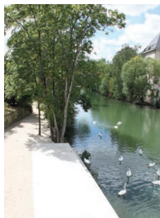
Ponton aménagé sur les bords de l'Oise près de l'Hôtel de Ville

Les travaux concernent aussi les berges de l'Oise extérieures qui ont été renforcées de façon à faciliter l'accès aux promeneurs. Des pontons et des chemins aménagés permettent de bénéficier d'un cadre plaisant.