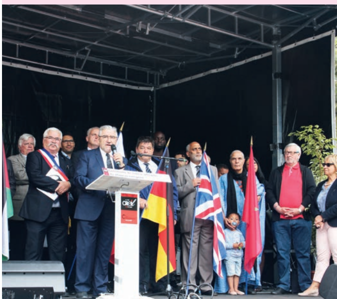
Remise du Drapeau d'honneur en présence de Jean-Claude Frécon, sénateur et vice-président du Congrès du Conseil de l'Europe