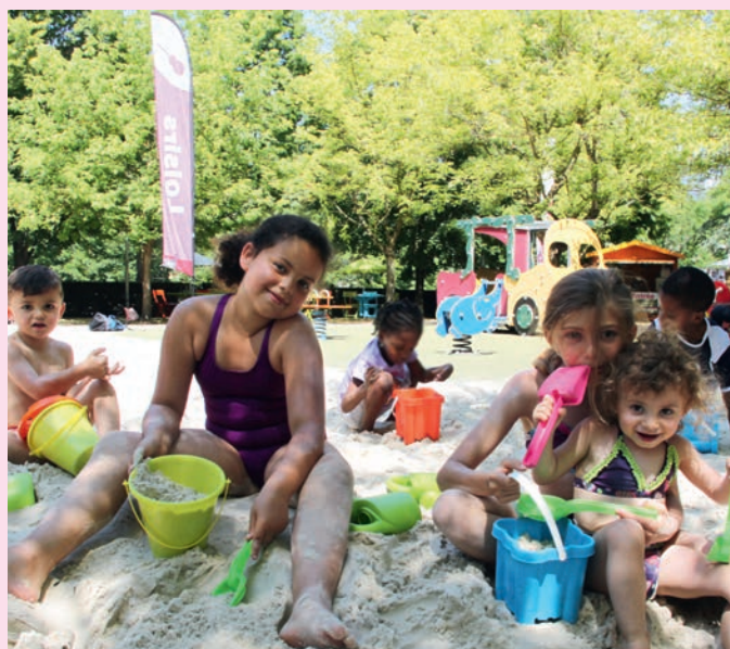
Creil, Bords de l'Oise a profité aux petits Creillois pour leur plus grand plaisir. Au programme : bac à sable, pataugeoire, piscine...