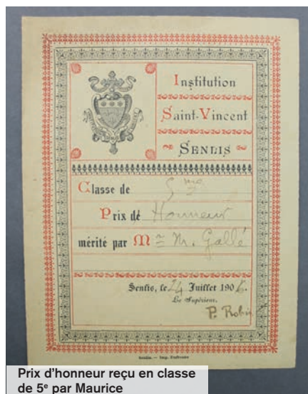
Prix d'honneur reçu en classe de 5 e par Maurice

Le matin, le magister enfilait sa blouse grise. Il prenait la grande bouteille d'encre violette et remplissait l'encrier des élèves. Ces derniers utilisaient un porte-plume. Lentement, ils écrivaient en traçant des pleins et des déliés. Certains enfants étaient maladroits. Ils faisaient des ratures, des trous quand ils voulaient gommer la tâche, de gros pâtés quand la plume accrochait le papier. Ils avaient de l'encre sur tous les doigts et même sur le bout du nez.