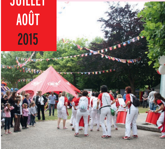
Reflet de la diversité des activités proposées, les associations de Creil étaient présentes à la Fête des Associations

Creil, Bords de l'Oise - du 11 juillet au 9 août 2015 - Parc municipal de la Faïencerie