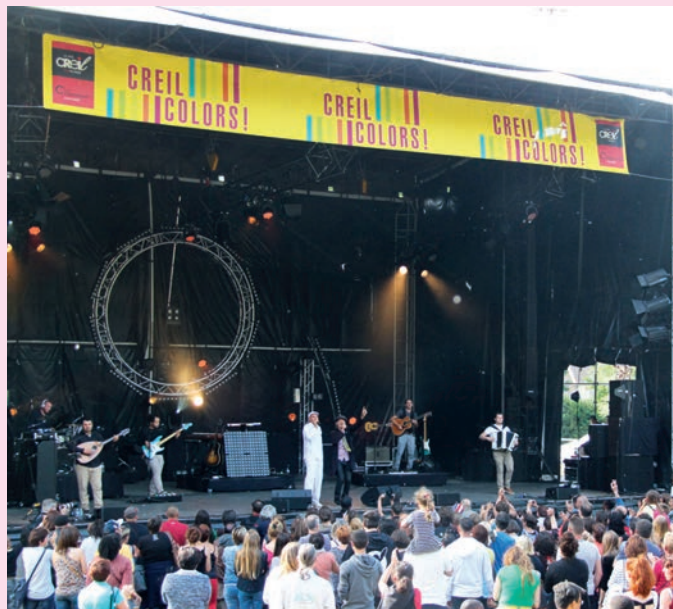
Dans le parc municipal de la Faïencerie, les artistes du festival Creil Colors face à la foule creilloise