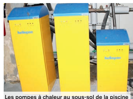
Les pompes à chaleur au sous-sol de la piscine

i La Piscine 03 44 67 25 32 / lapiscine@mairie-creil.fr