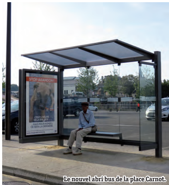
Le nouvel abri bus de la place Carnot.

i Direction des Services Techniques 03 44 29 51 04 direction.services.techniques@mairie-creil.fr