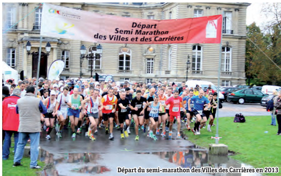
Départ du semi-marathon des Villes des Carrières en 2013

Ne manquez pas, le dimanche 19 octobre 2014 , le 6 e semi-marathon des Villes et des Carrières, événement incontournable du sud de l'Oise.