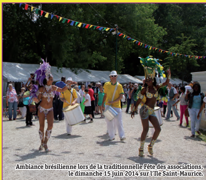
Ambiance brésilienne lors de la traditionnelle Fête des associations, le dimanche 15 juin 2014 sur l'Île Saint-Maurice.