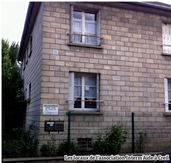
Les locaux de l'association Interm'Aide à Creil

L'association Interm'Aide constate que les sollicitations des personnes concernent principalement les services administratifs publics tels que la Mairie ou la Caisse d'Allocations Familiales (CAF), mais aussi le Trésor public et le Centre des Impôts. Des organismes privés comme la Lyonnaise des Eaux, EDF ou des banques sont également concernés. Les demandes relèvent aussi beaucoup des services de santé avec en premier lieu la Caisse Primaire