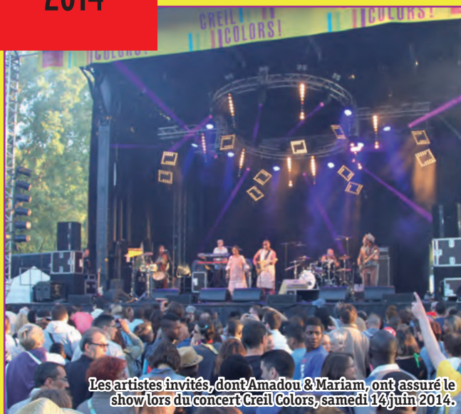
Les artistes invités, dont Amadou & Mariam, ont assuré le show lors du concert Creil Colors, samedi 14 juin 2014.