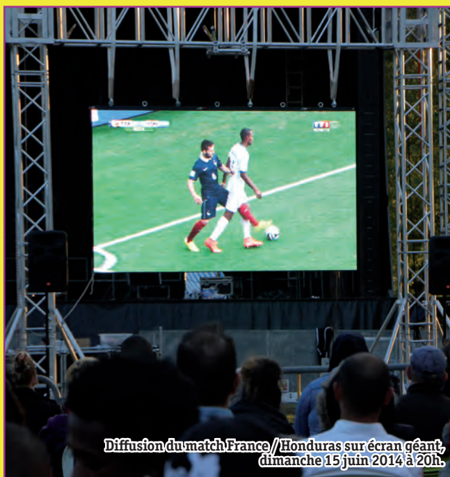
Diffusion du match France // Honduras sur écran géant, dimanche 15 juin 2014 à 20h.