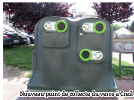
Nouveau point de collecte du verre à Creil

Recycler le verre, c'est aussi faire des économies de fioul et de sable, sans parler de l'économie pécuniaire.