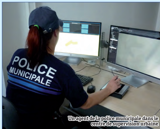
Un agent de la police municipale dans le centre de supervision urbaine

Les services de la police nationale disposeront d'un export d'images leur permettant de visualiser 24h/24h, 7 jours sur 7, les espaces protégés.