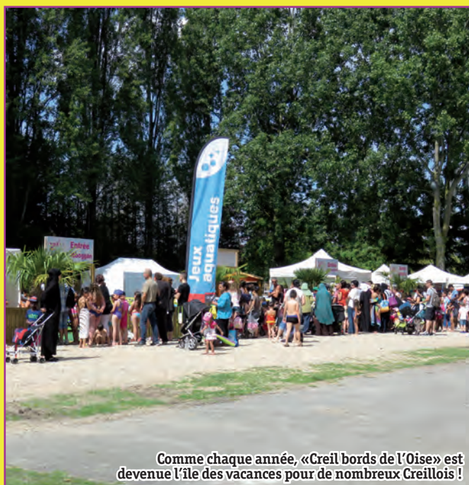
Comme chaque année, «Creil bords de l'Oise» est devenue l'île des vacances pour de nombreux Creillois !