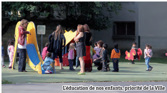
L'éducation de nos enfants, priorité de la Ville

Entre les dépenses de fonctionnement et les investissements dans ces domaines, ce sont plus de 7 M€ qui sont consacrés à l'éducation et à l'enseignement. À ce titre, le système des Temps d'Activités Périscolaires (TAP), mis en place en 2013, participe à l'éveil de nos enfants.