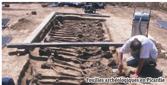
Fouilles archéologiques en Picardie

Dans le cadre des commémorations de la guerre de 14-18, la Fédération de la Libre Pensée de l'Oise donne la parole aux archéologues, le vendredi 20 juin 2014 à l'IUT de Creil à 20h.