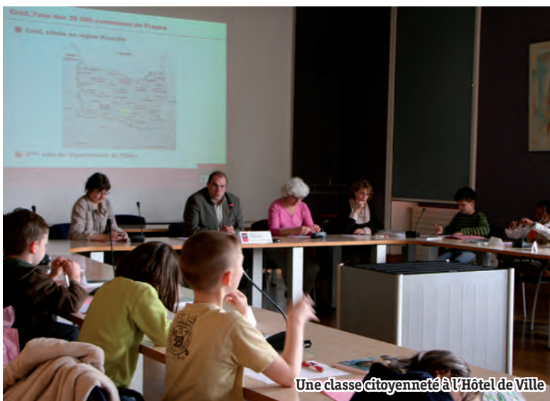
Une classe citoyenneté à l'Hôtel de Ville

Les élèves travaillent notamment sur un questionnaire général sur l'organisation des collectivités territoriales en France qu'ils remplissent en présence de l'élu. Ils découvrent également la liste des maires de Creil depuis la Révolution.