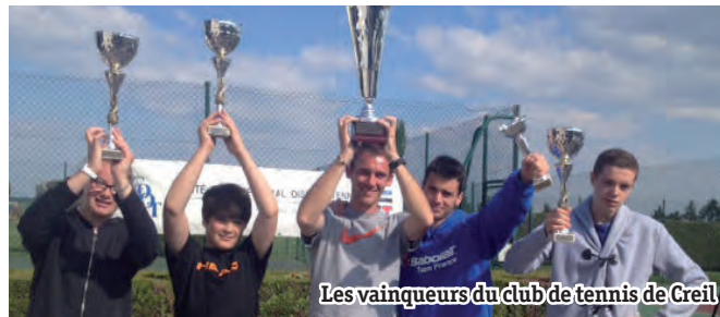
Les vainqueurs du club de tennis de Creil

Les championnats de l'Oise se sont déroulés le 17 mai à Méru. Le club de Tennis de Creil a brillé avec 4 vainqueurs et 1 finaliste :