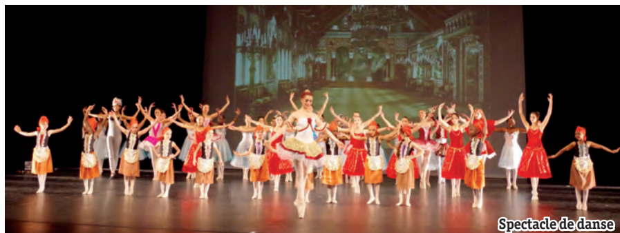
Spectacle de danse

Les inscriptions et réinscriptions sont ouvertes au Conservatoire Municipal de Musique et de Danse à partir du 2 juin 2014.