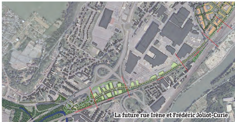
La future rue Irène et Frédéric Joliot-Curie

Dans la continuité de la réalisation du carrefour des Forges sur le territoire de la commune de Montataire, les travaux relatifs à la construction de la nouvelle voie de desserte du quartier Gournay / Les Usines reliant Creil et Montataire, et menés sous maîtrise d'ouvrage de la Communauté de l'Agglomération Creilloise, sont en voie d'achèvement.