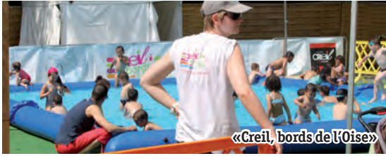
«Creil, bords de l'Oise»

«Creil, Bords de l'Oise», ce sont 5 semaines dédiées aux loisirs et à la détente, sur le site exceptionnel de l'île Saint-Maurice, bercée par l'Oise.