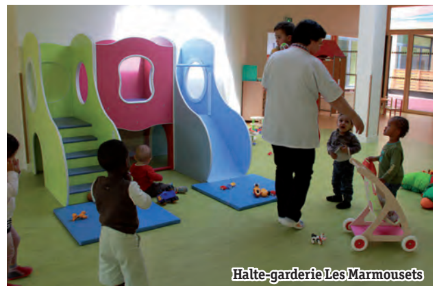
Halte-garderie Les Marmousets

Ce sont près de 5 M€ que la Ville met à disposition de sa politique sociale. Il s'agit de moyens conséquents pour maintenir le service fourni en terme de soutien quotidien aux habitants (crèches, santé...). La Ville n'oublie pas le Centre Communal d'Action Sociale (CCAS) auquel elle versera en 2014 une aide de 1,6 M€.