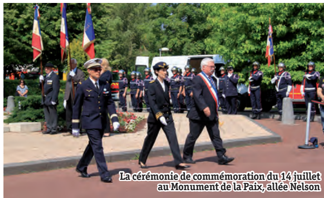
La cérémonie de commémoration du 14 juillet au Monument de la Paix, allée Nelson

La cérémonie du 14 juillet, fête nationale, aura lieu à 11h30 au Monument de la Paix , allée Nelson, avec notamment la participation des enfants de l'accueil de loisirs Monique et Michel Leclerc.