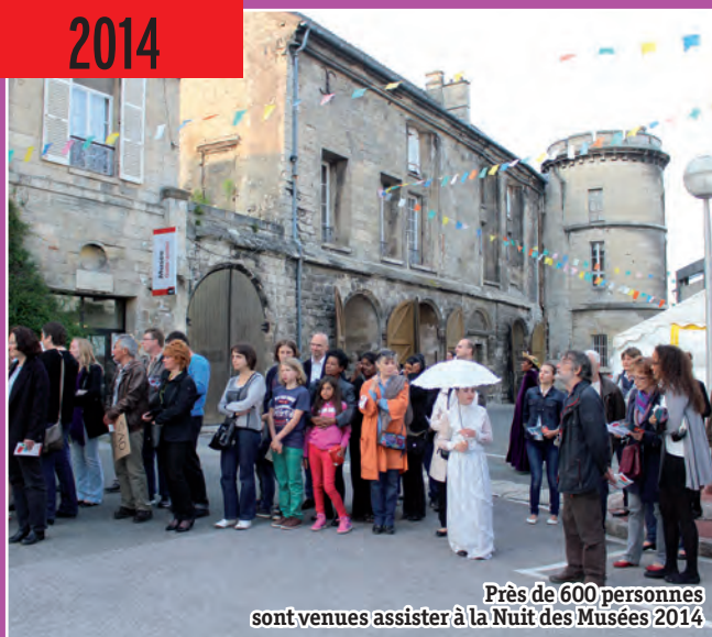
Près de 600 personnes sont venues assister à la Nuit des Musées 2014

Jeu-concours Retrouvez les réponses en page 17