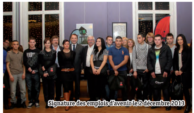
Signature des emplois d'avenir le 2 décembre 2013

Avec 4 M€ dédiés, de nombreux outils sont mis à disposition des jeunes. En terme d'entrée dans la vie active, la création de 30 emplois d'avenir au sein de la mairie est un premier levier, avec une vraie perspective d'évolution.