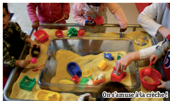
On s'amuse à la crèche!

Voici les animations et sorties dans les structures de la petite enfance.