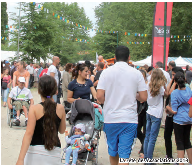
La Fête des Associations 2013

Espace Buhl - 36 rue Aristide Briand 03 44 29 51 85 - sports@mairie-creil.fr