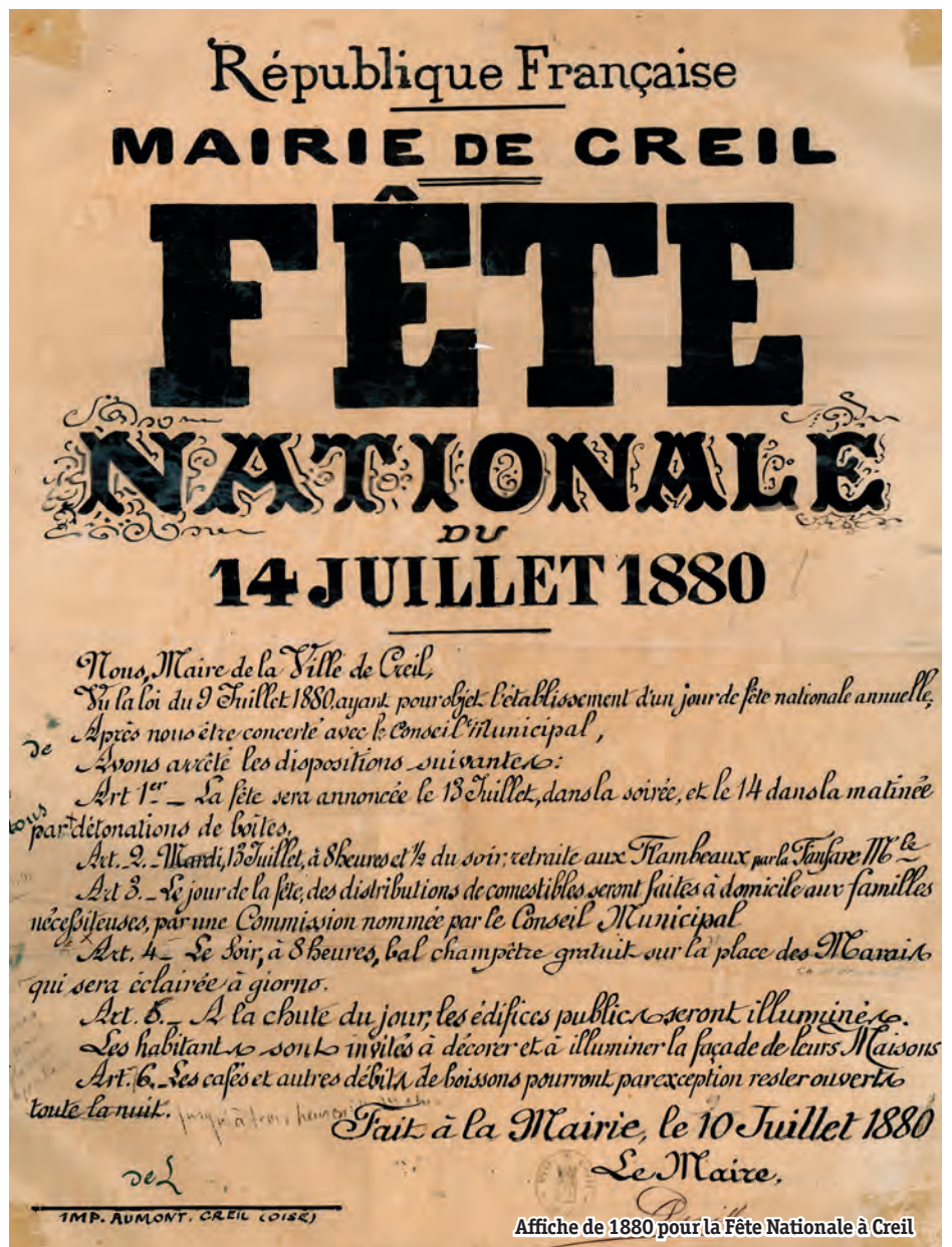
Affiche de 1880 pour la Fête Nationale à Creil

Lundi, Mardi et jeudi de 13h30 à 17h Mercredi et vendredi : 9h à 11h30 et 13h30 à 17h