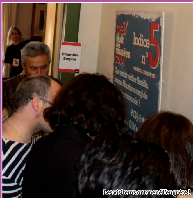
Les visiteurs ont mené l'enquête!