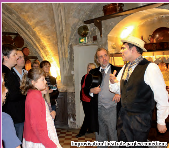
Improvisation théâtrale par les comédiens