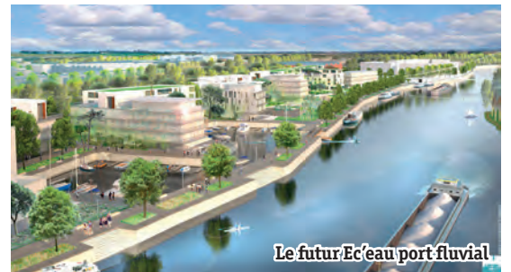
Le futur Ec'eau port fluvial

Le bilan sera consultable au service urbanisme, ainsi que sur le site internet de la commune.