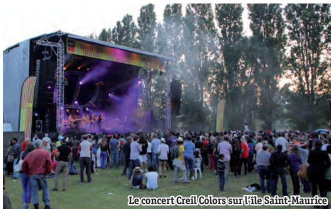
Le concert Creil Colors sur l'île Saint-Maurice

L'accessibilité de la culture à tous est un des piliers de notre société. En y consacrant 4,5 M€, la Ville renouvelle cette année encore son programme de manifestations conviviales gratuites, comme le concert Creil Colors au mois de juin. À cela, s'ajoutent les nombreuses animations dans les différentes structures culturelles.