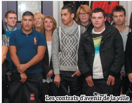
Les contrats d'avenir de la ville

La ville propose des contrats de 3 ans dans la perspective de faire évoluer les jeunes en compétences. Certains pourront passer les concours de la fonction publique grâce aux formations proposées par le CNFPT de l'Oise.